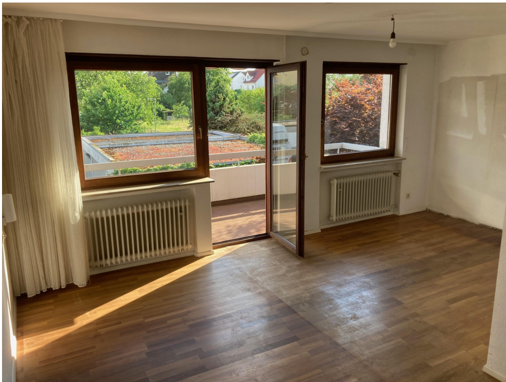
Großes Schlafzimmer 1.OG