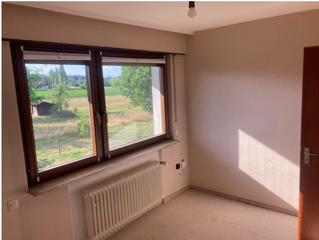
2. Zimmer 1. OG