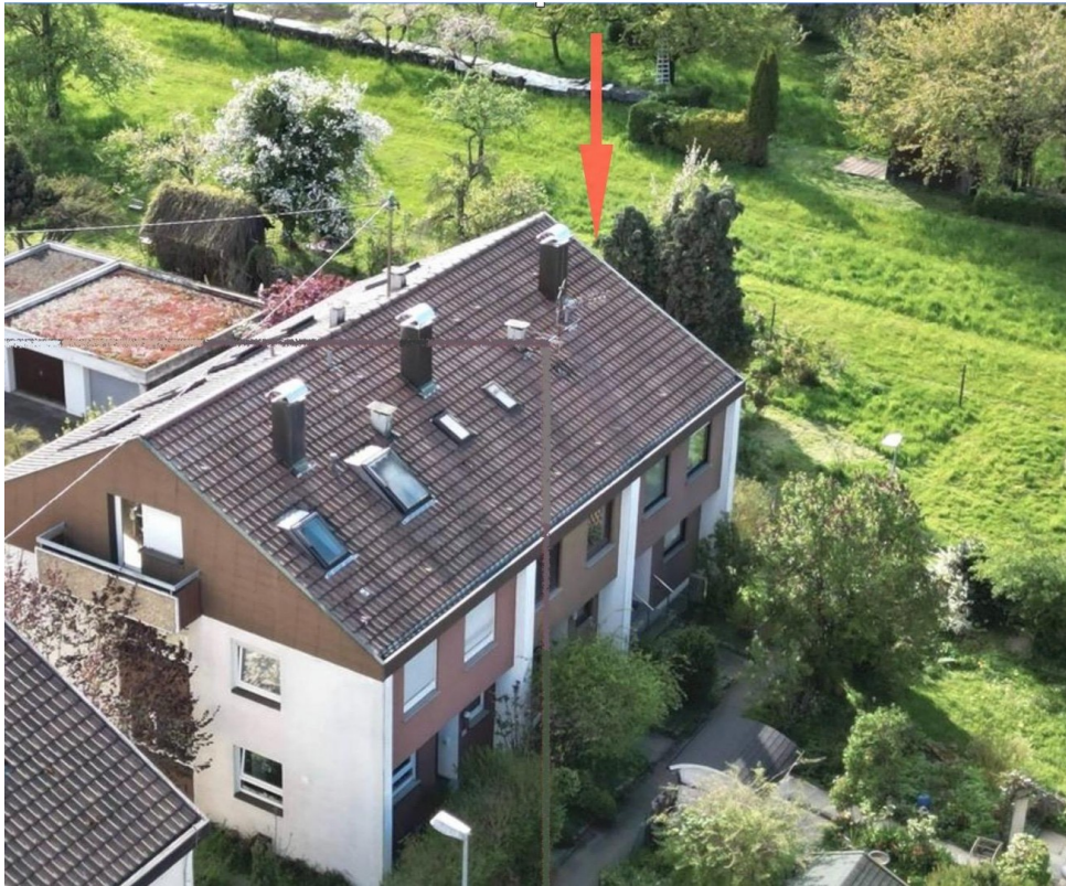
Haus und Garage