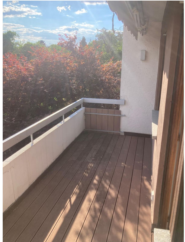
BalkonGroßes Schlafzimmer 1.OG