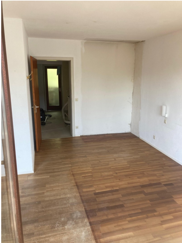
Großes Schlafzimmer 1.OG