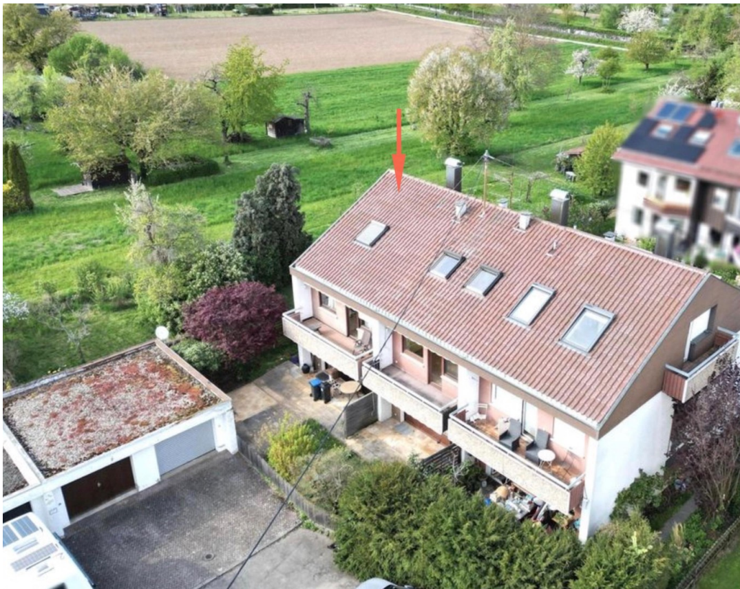
Haus und Garage