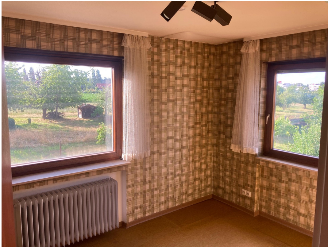
3. Zimmer 1. OG