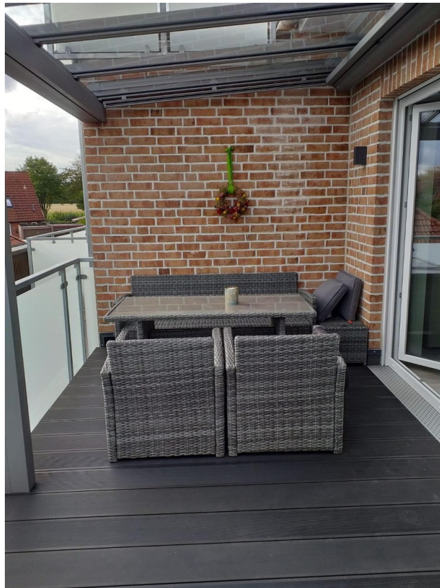
Teilweise Überdachter Balkon