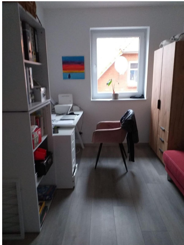
Gäste oder Büro