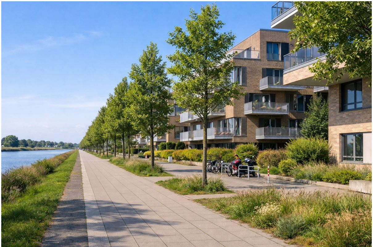
Promenade an der Weser