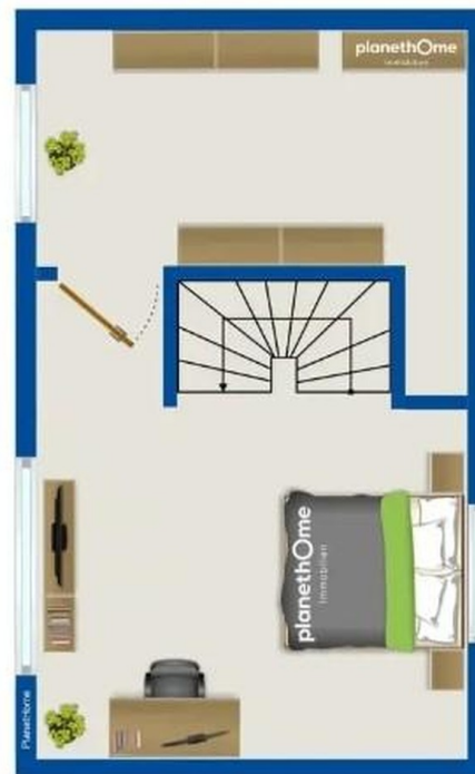
Schlafz. mit Nebenzimmer