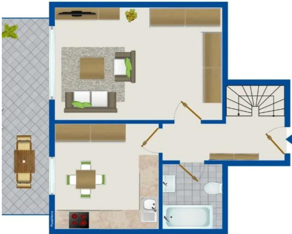
Balkon, Küche, Wohnz., Bad