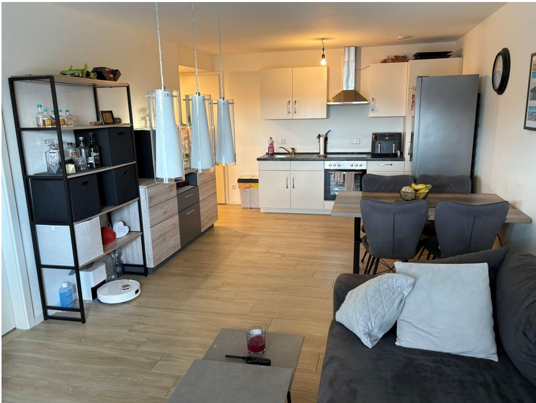
Wohnen - Essen - Kochen (2)