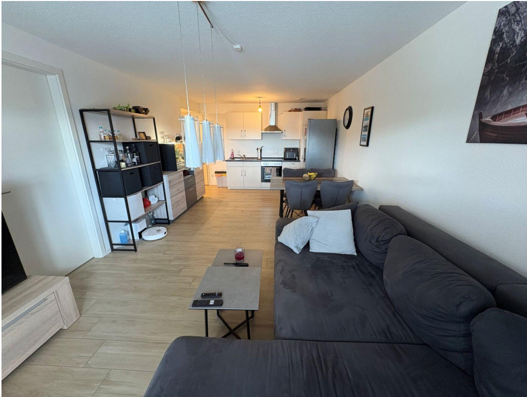
Wohnen - Essen - Kochen (1)