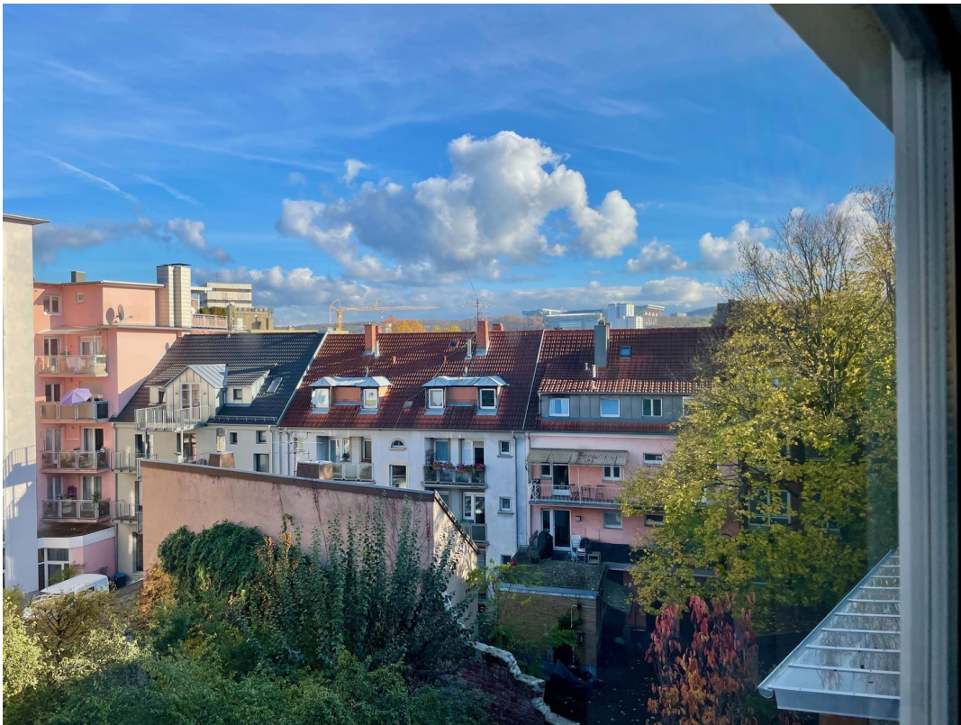
Blick Balkon in Innenhof