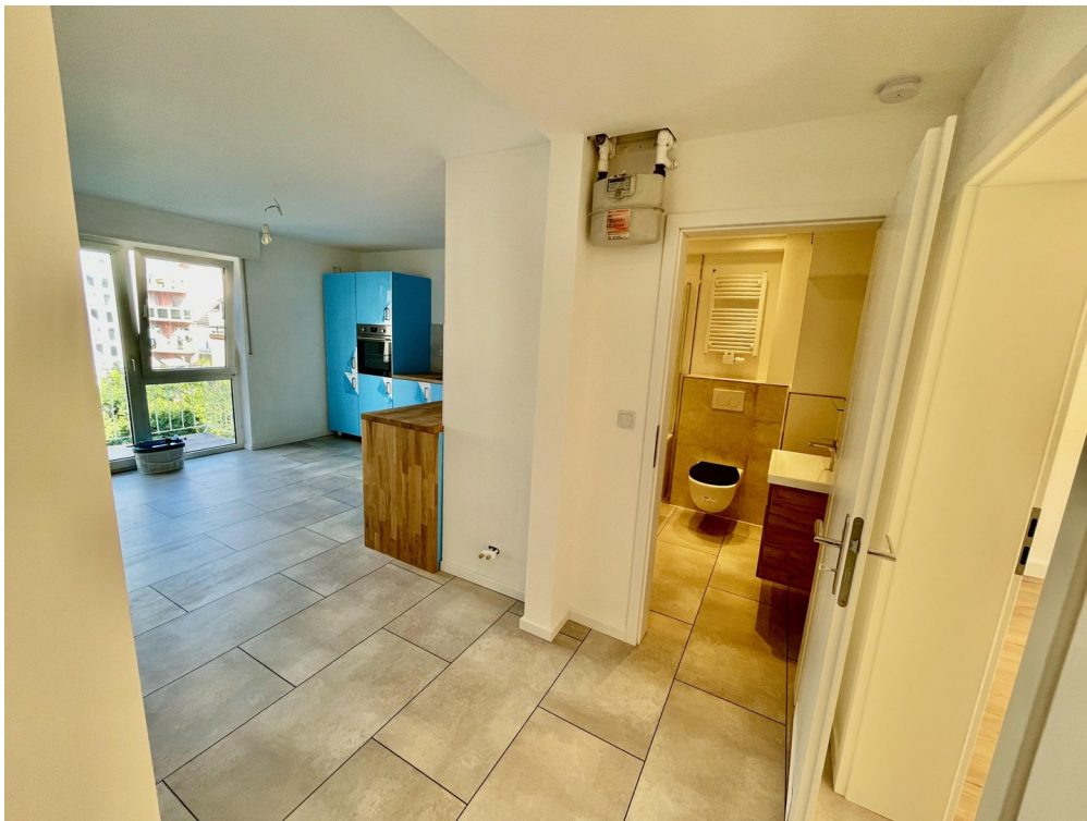
Blick Diele in Wohnküche