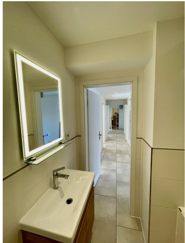
Blick Bad in Diele