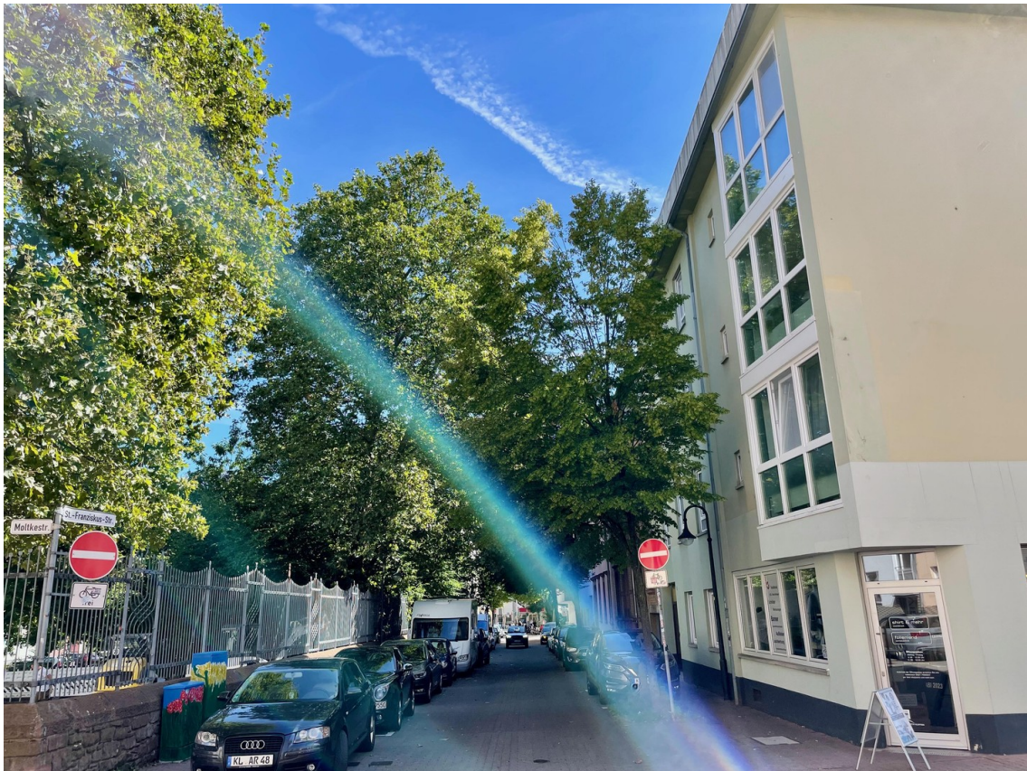
Ansicht St. Franziskus-Straße