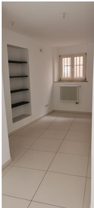
hinterer Teil Gewerbeinheit