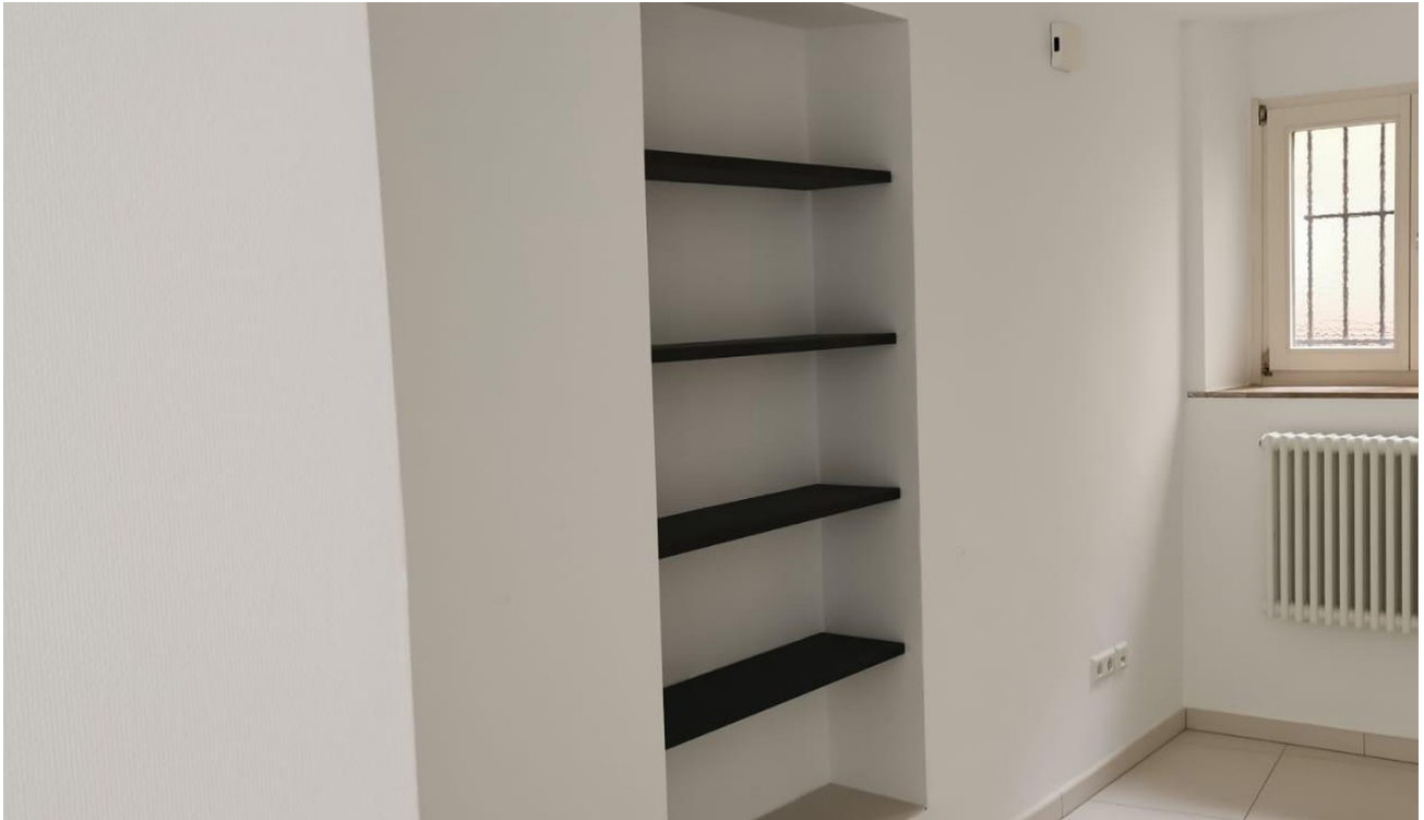
hinterer Teil Gewerbeeinheit