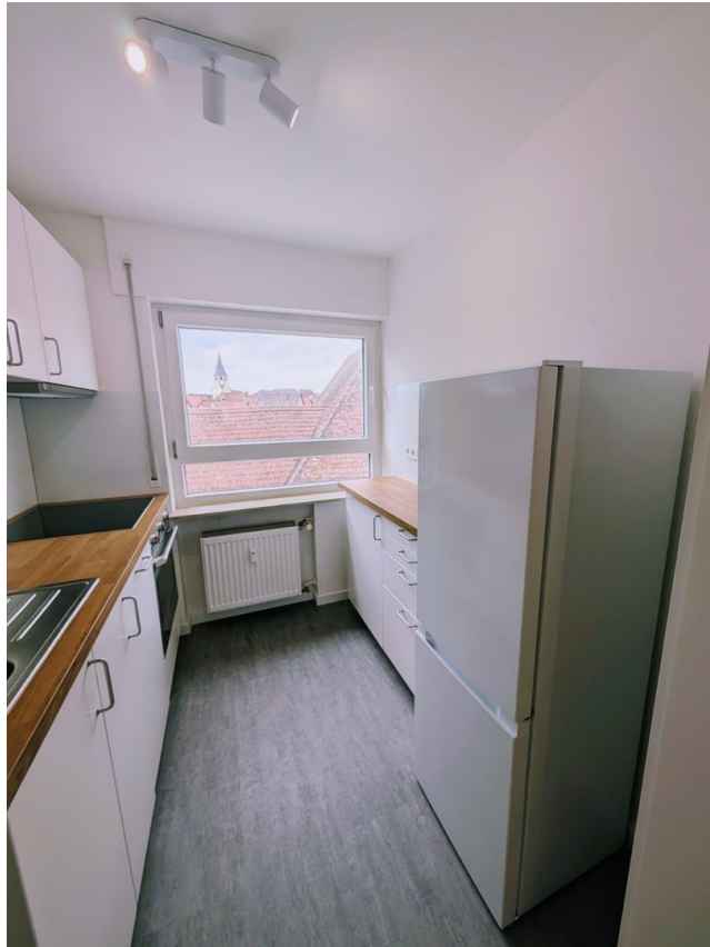
Neue EBK mit großem Fenster