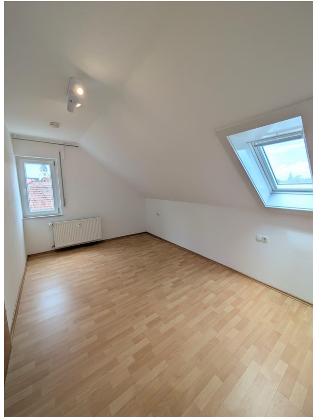
Schlafzimmer mit zwei Fenstern