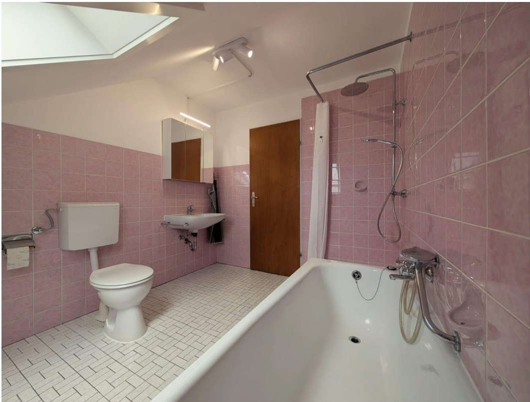
Bad mit Badewanne und Dusche