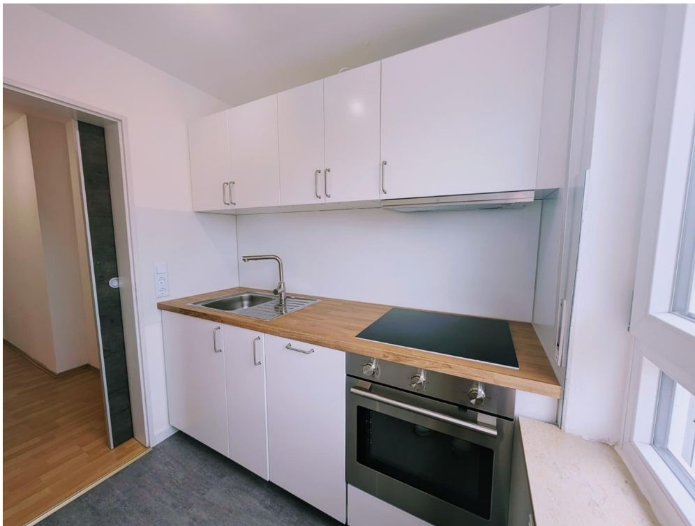
Neue EBK mit Elektrogeräten