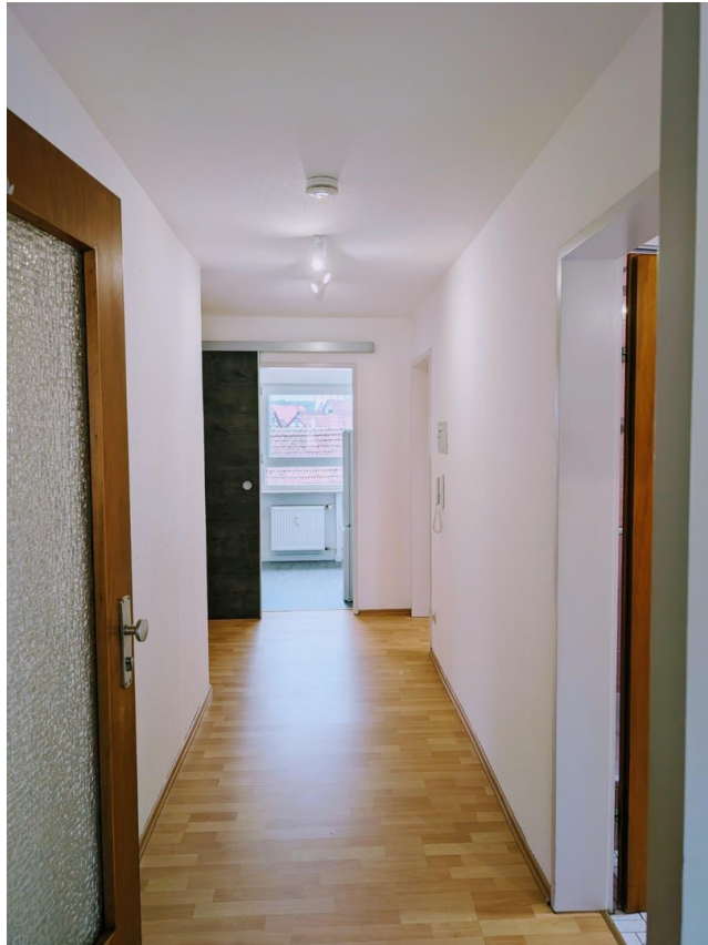
Willkommen in Ihrem Zuhause!