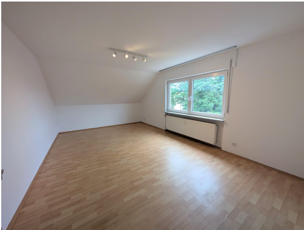
gemütliche, helle Wohnzimmer