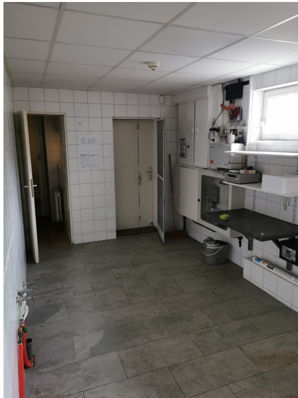
Personal-WC - Küche