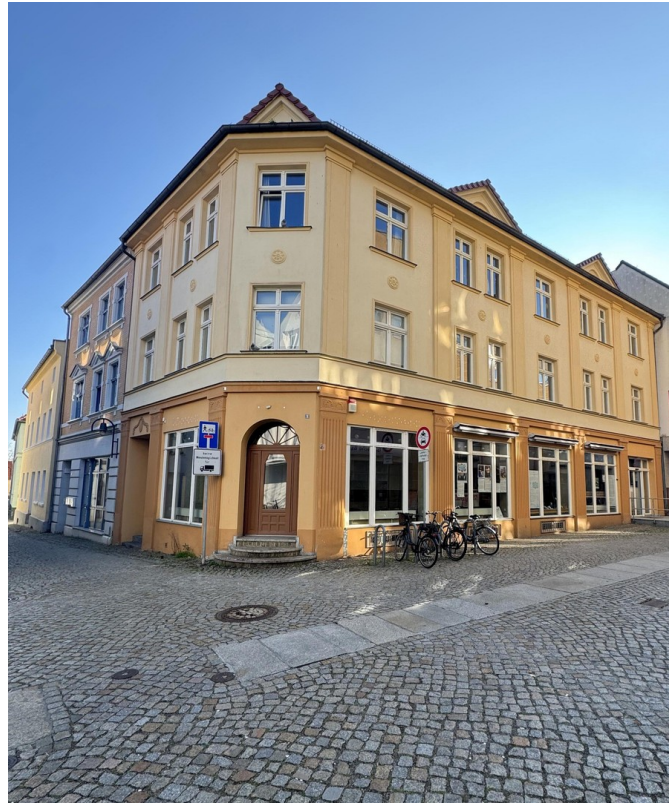
Außen - Eckansicht