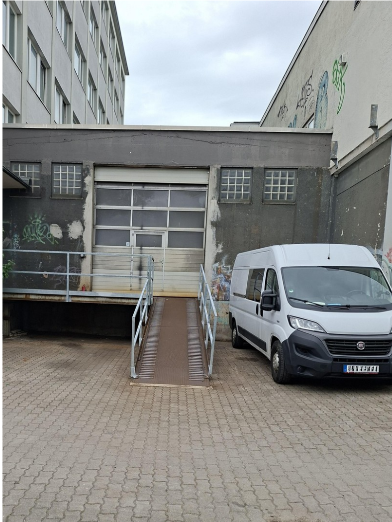
Werkstatt - Aussen