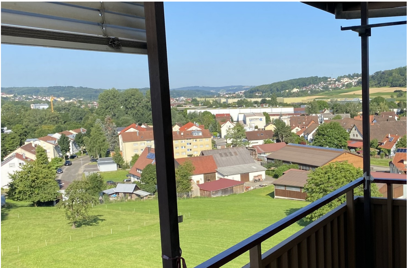
Balkon mit Aussicht