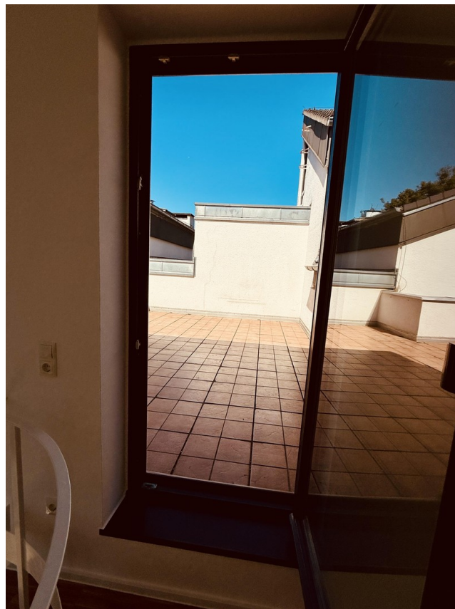
Empore Richtung Dachterrasse