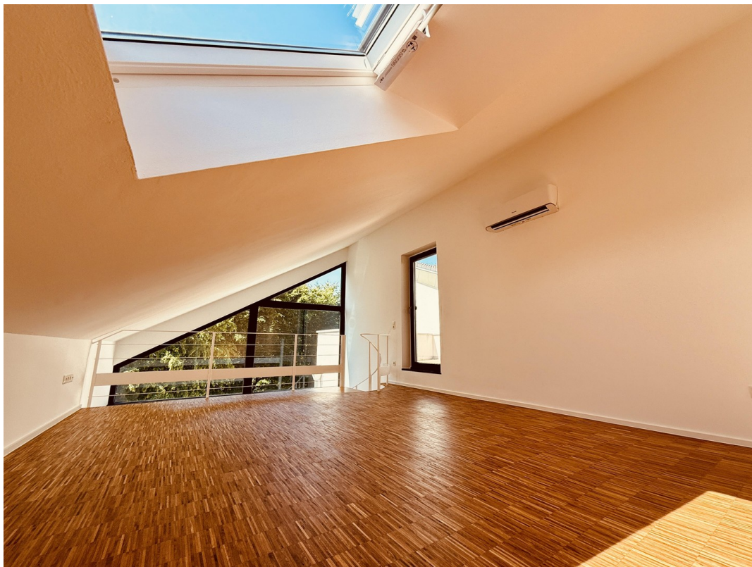
Empore Richtung Dachfenster