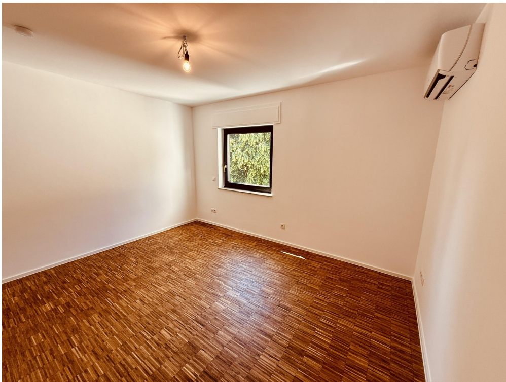
Schlafzimmer von rechts