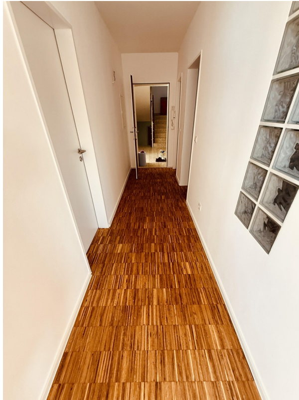
Flur Richtung Eingang