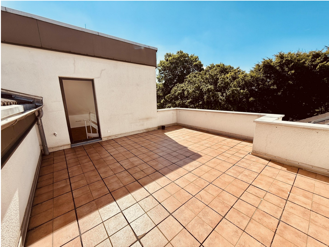
Dachterrasse Richtung Empore