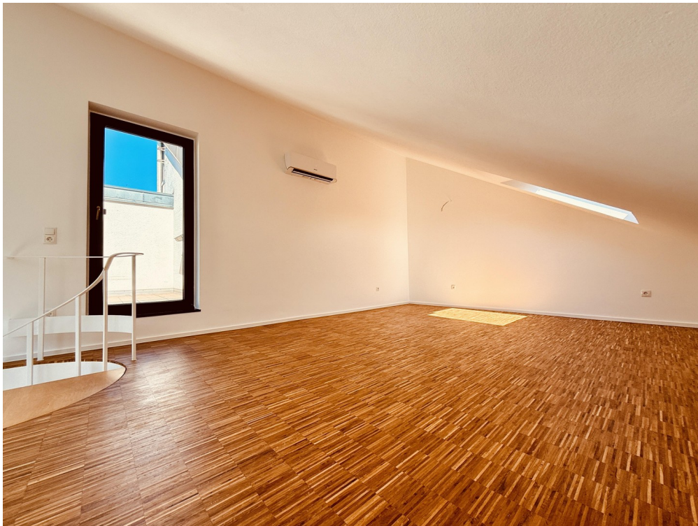
Empore Richtung Wand