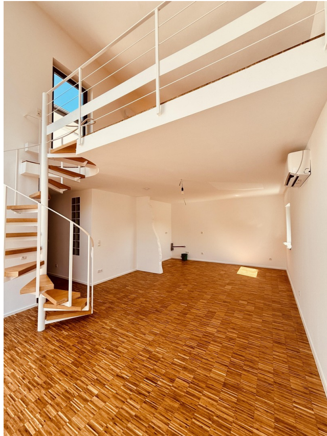
Wohnzimmer Richtung Küche