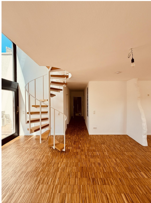
Wohnzimmer Richtung Eingang