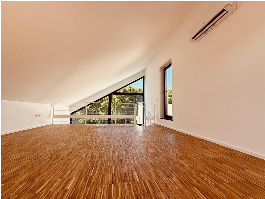
Empore Richtung Geländer