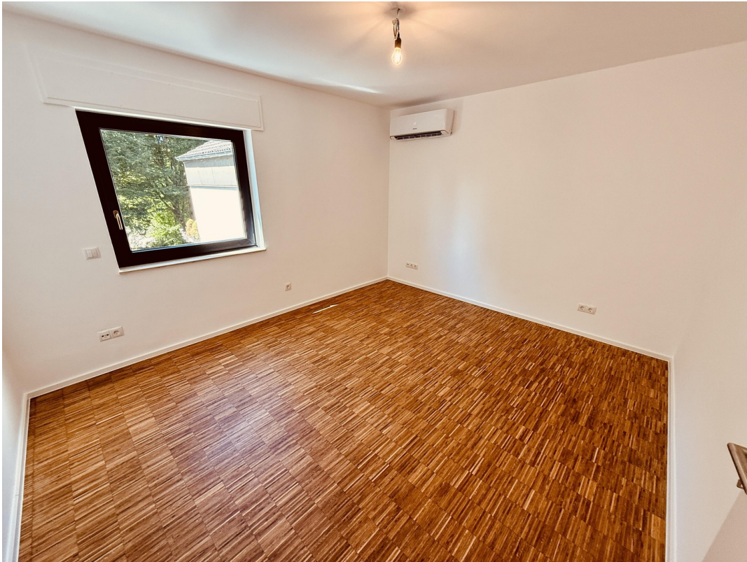
Schlafzimmer von links