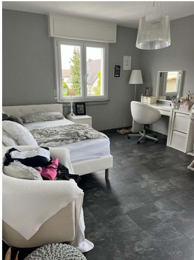
1.OG Kinderzimmer 2