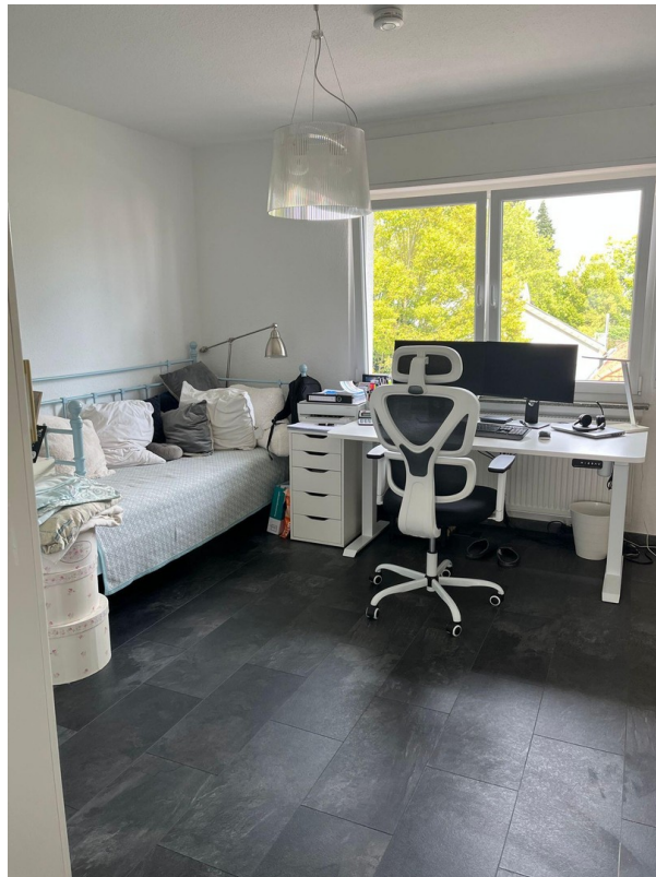
1.OG Kinderzimmer 1