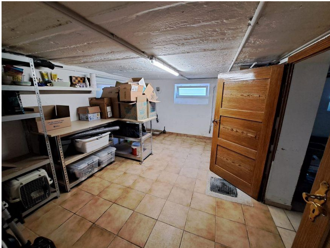
Keller Raum 1