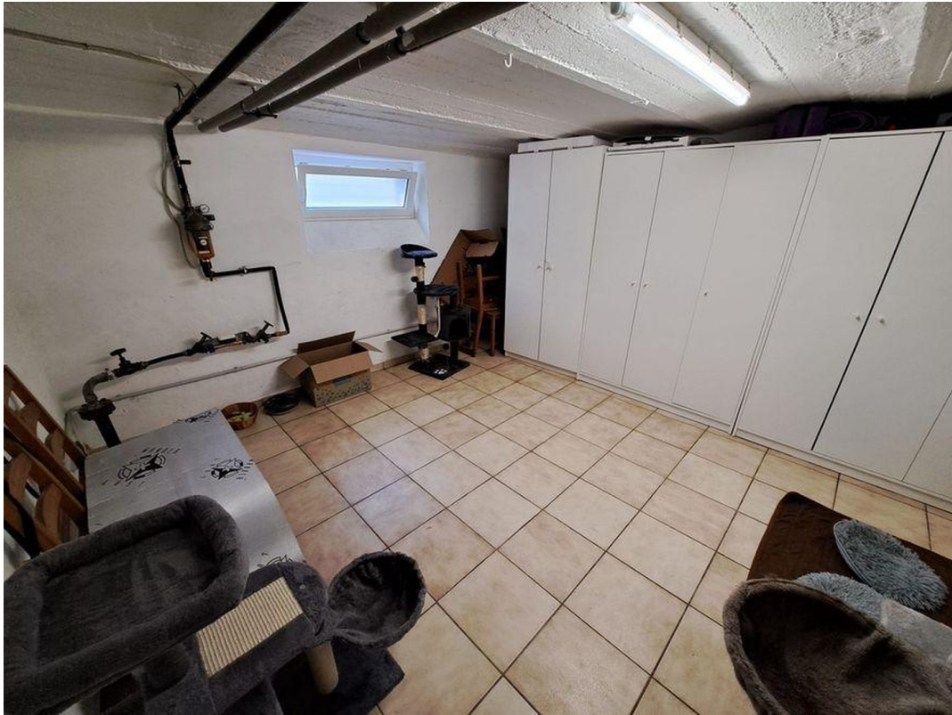
Keller Raum 2