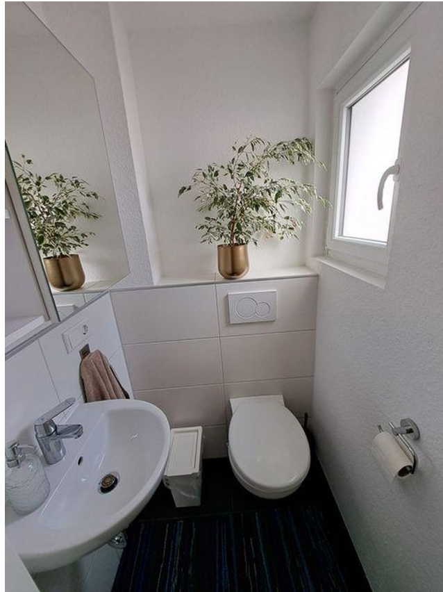
EG Gäste WC