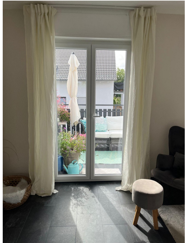
1.OG Zugang Balkon