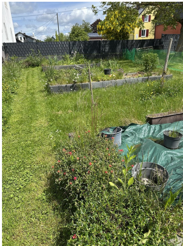
19 - Garten Hochbeete