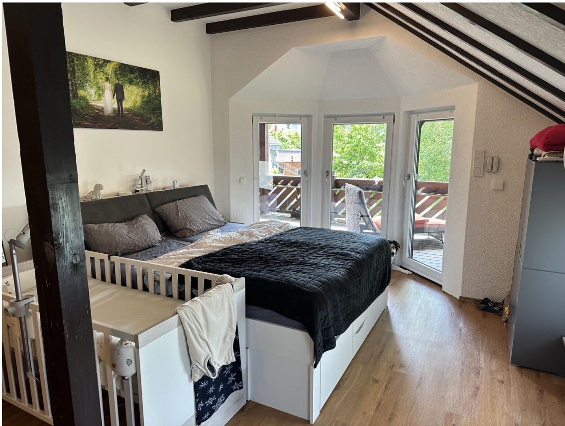
02 - Galerie-Schlafzimmer