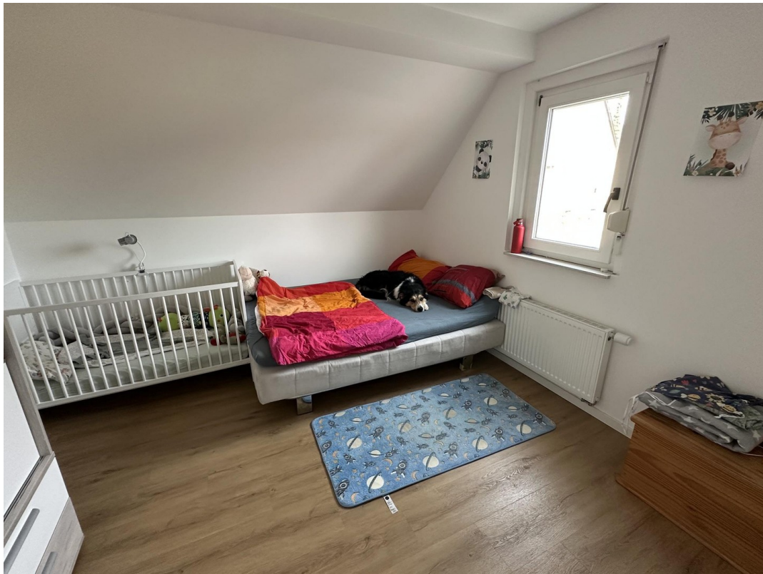
16 - Kinderzimmer