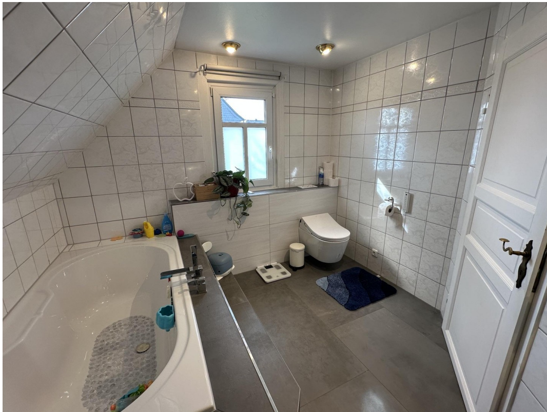
13 - Badezimmer OG