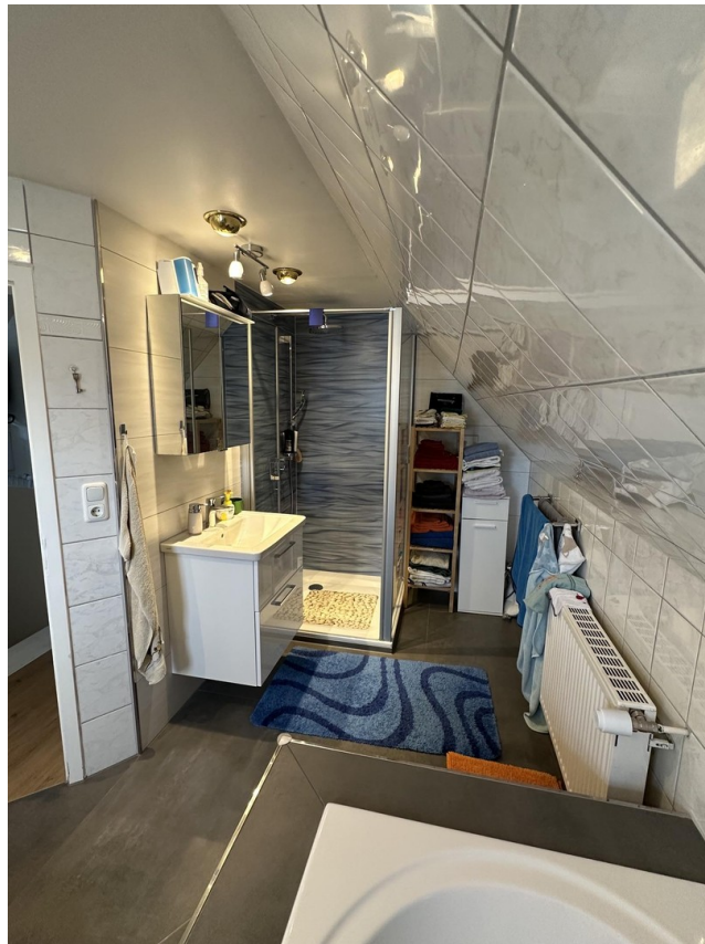
14 - Badezimmer OG Dusche