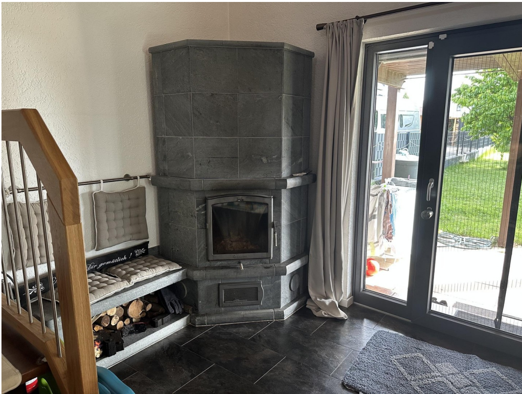
07 - Kamin