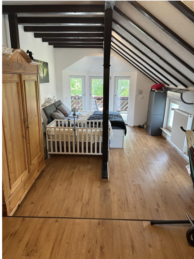
03 - Galerie-Schlafzimmer