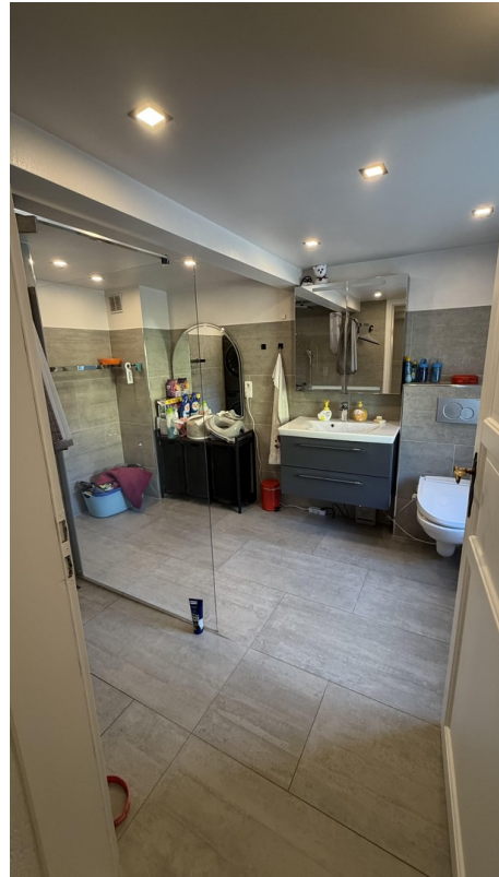
12 - Badezimmer EG Waschtisch