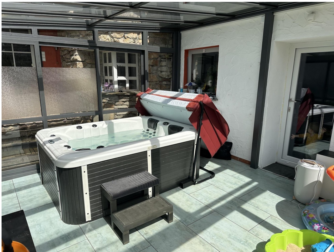
06 - Wintergarten + Whirlpool