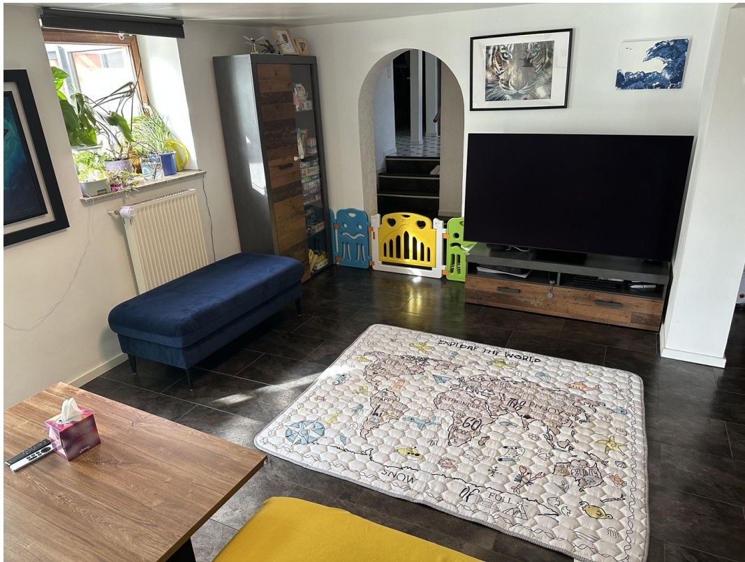
05 - Wohnzimmer