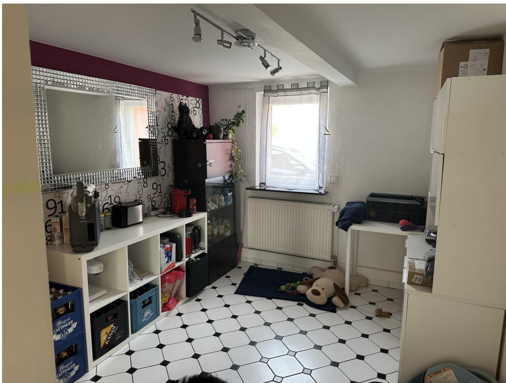
10 - Frühstückszimmer