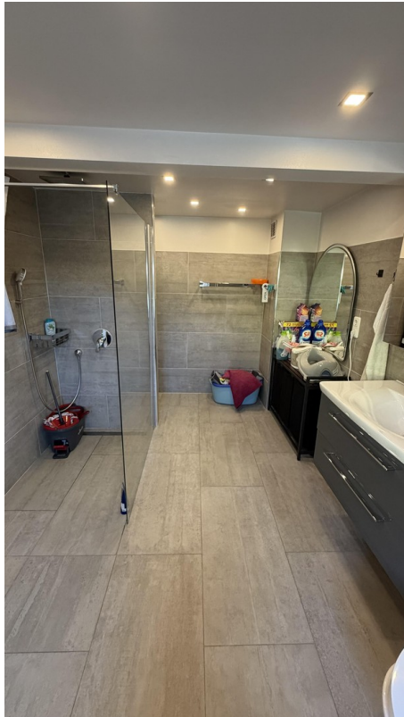
11 - Badezimmer EG Dusche