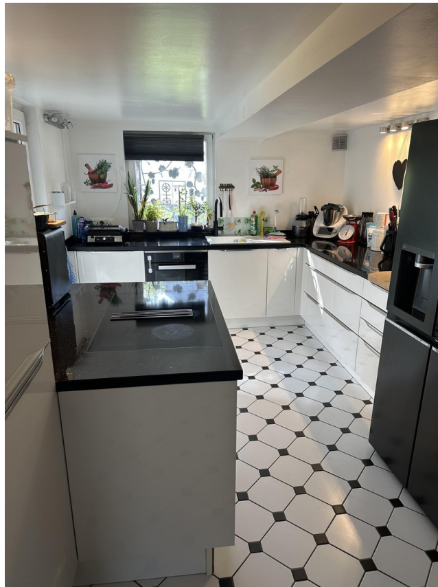
09 - Küche