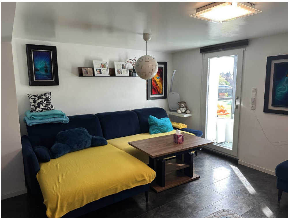
04 - Wohnzimmer