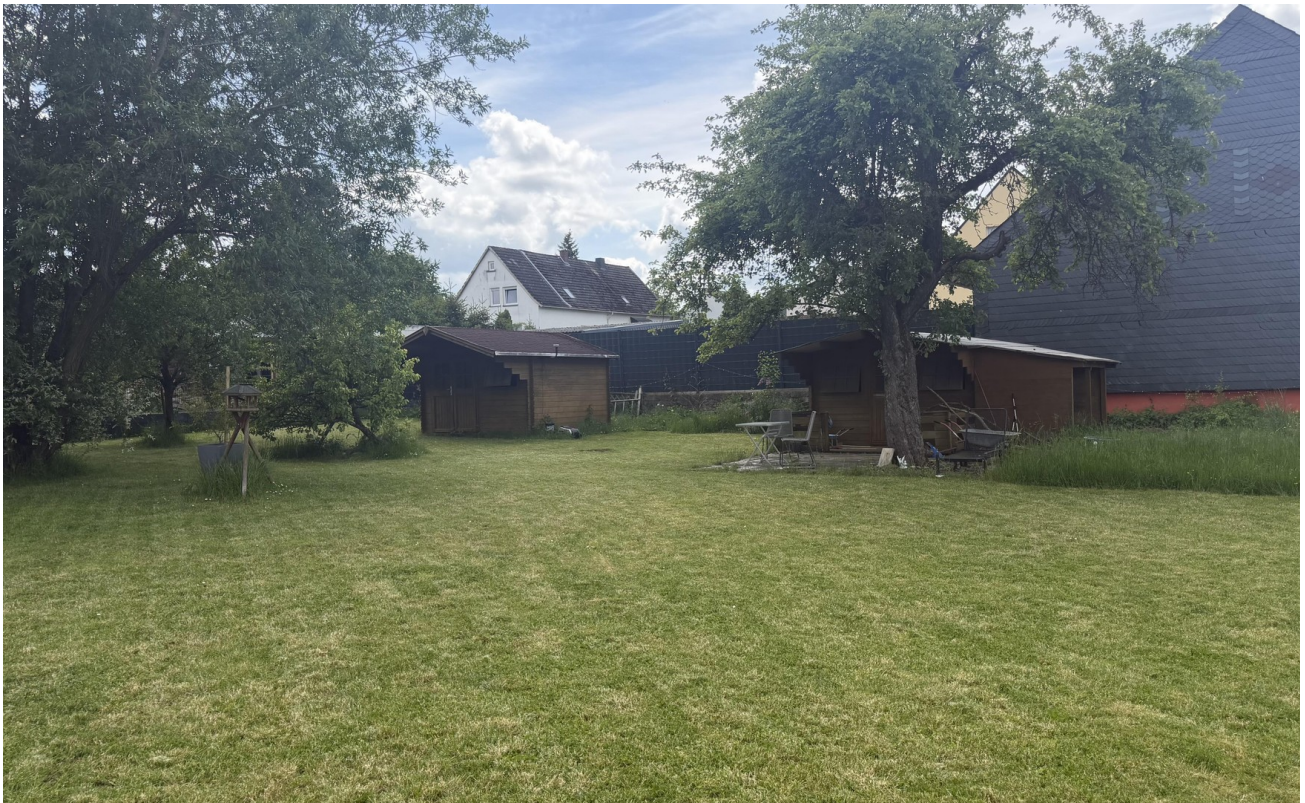
17 - Gartenhütten