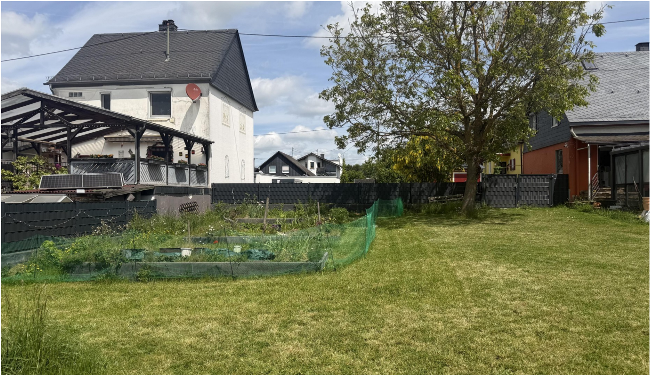
18 - Garten mit Hochbeeten