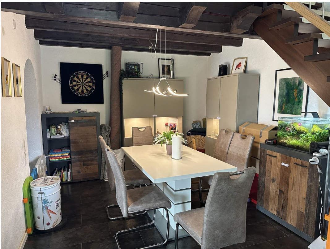
08 - Esszimmer