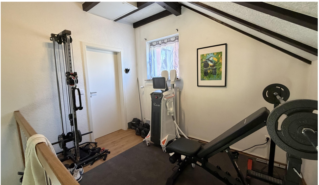
15 - Aufenthaltsbereich OG