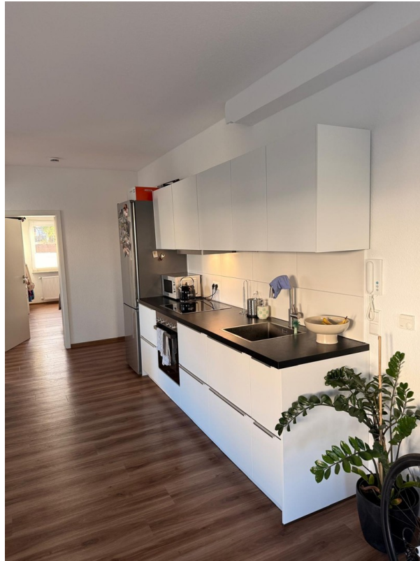
Küche-Abverkauf über Mieter!