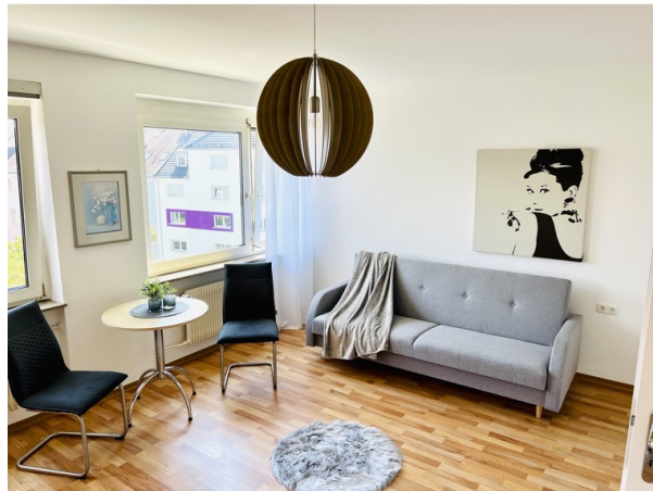
Wohnbereich 2. Ansicht