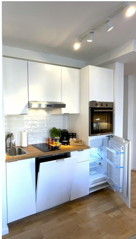
Musterküche als Option