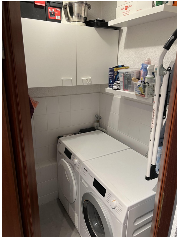
Waschraum / WC