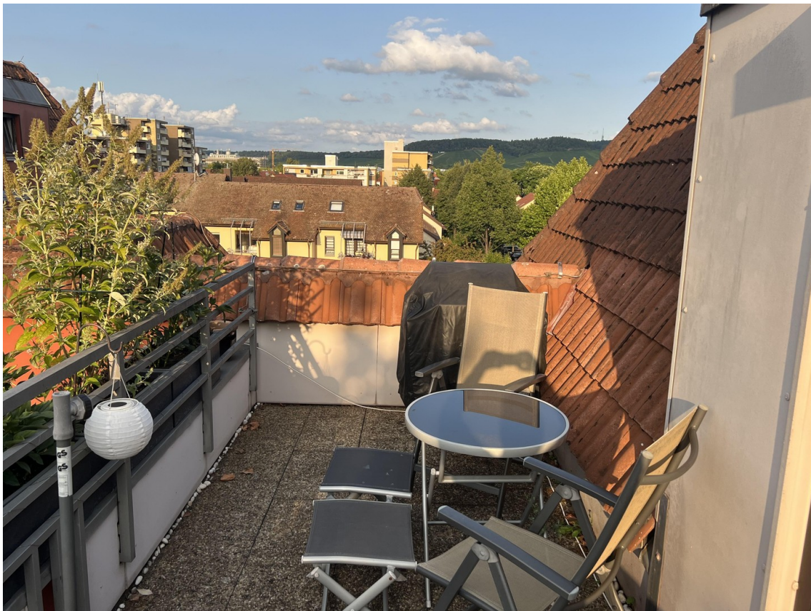
Dachterasse ohne Einsicht