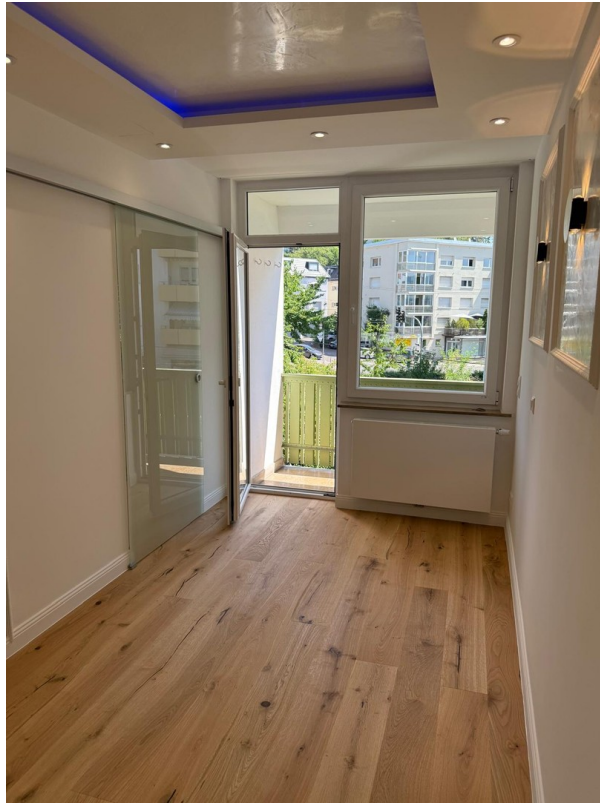
Flur und Essbereich