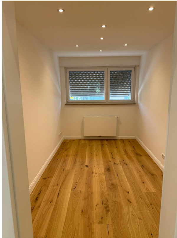
Arbeits- oder Kinderzimmer