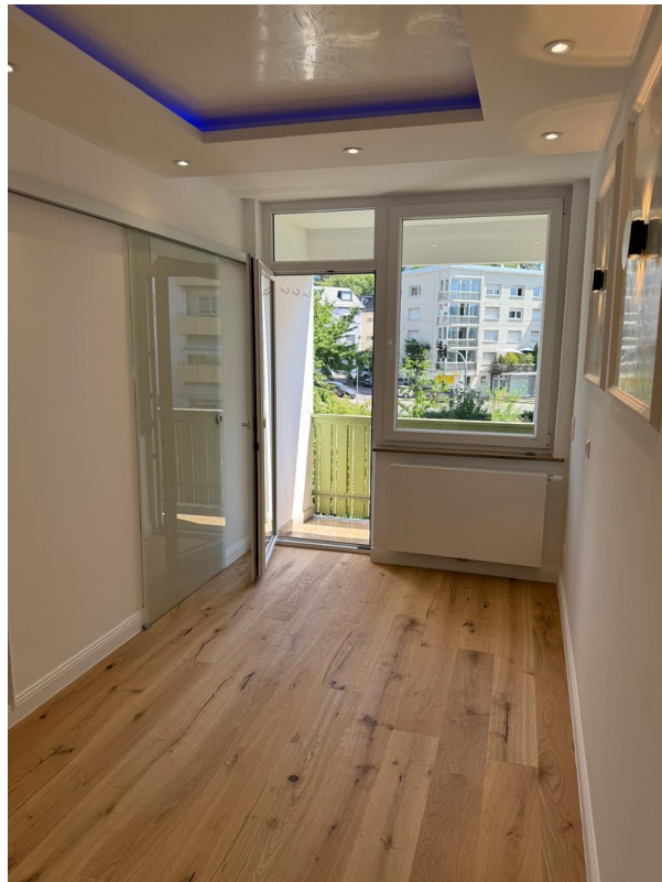
Flur Richtung Balkon 2