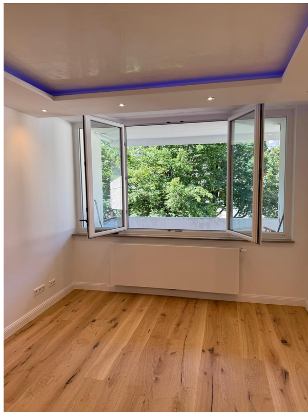
Schlafzimmer zum großen Balkon