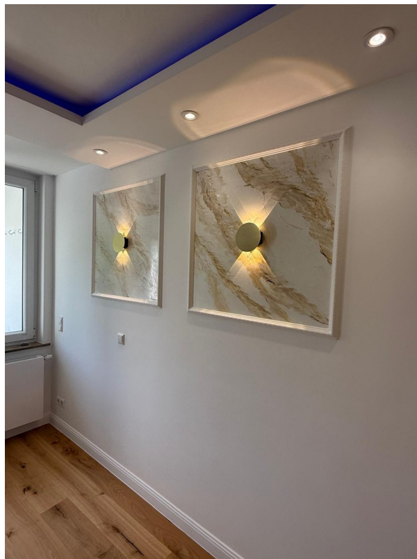
Highlights im Essbereich/Flur