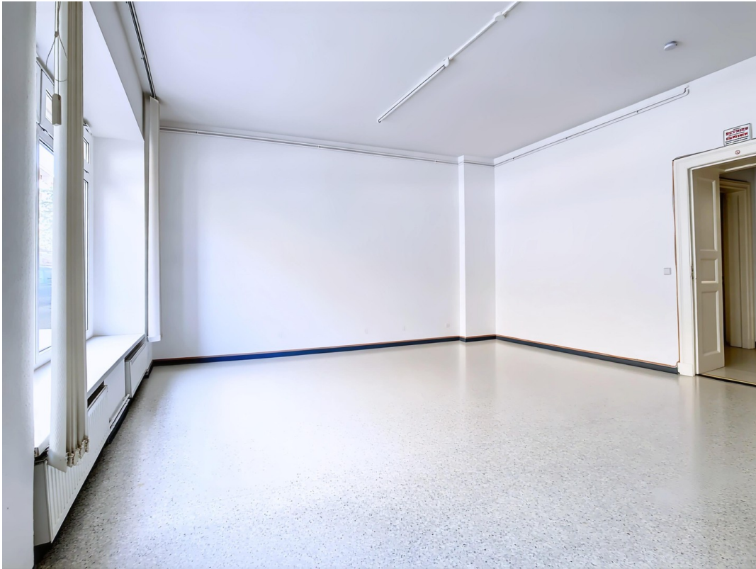
Geschäftsfläche zur Straße