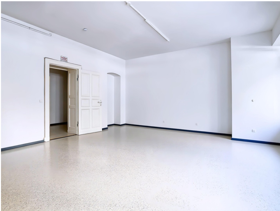
Geschäftsfläche zur Straße