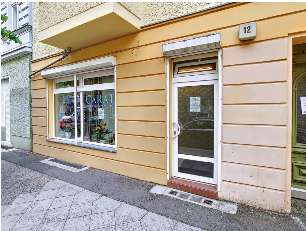
Straßeneingang + Schaufenster