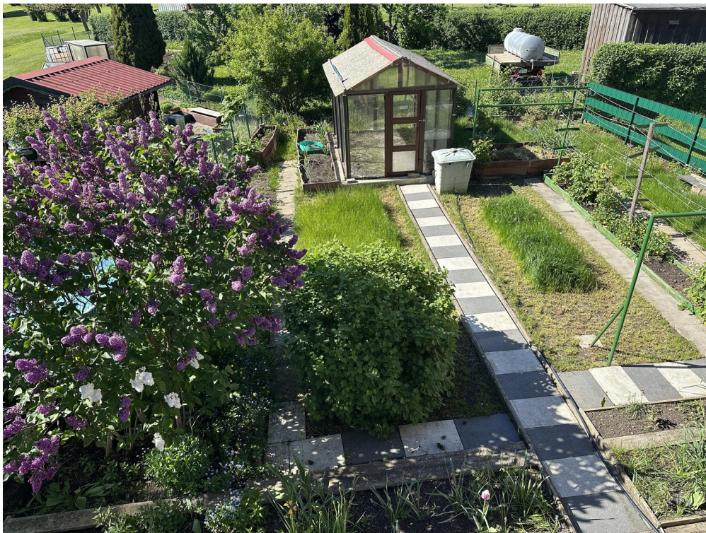
Grundstück mit Garten