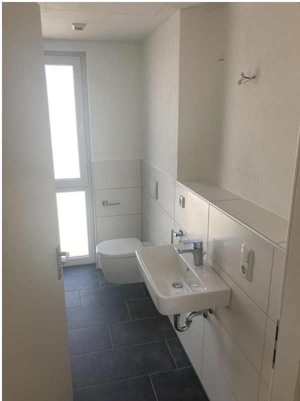
Bad mit Dusche und Fenster