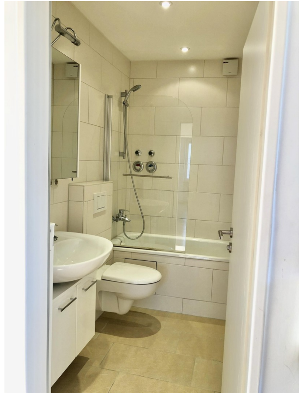
Badezimmer mit Wanne