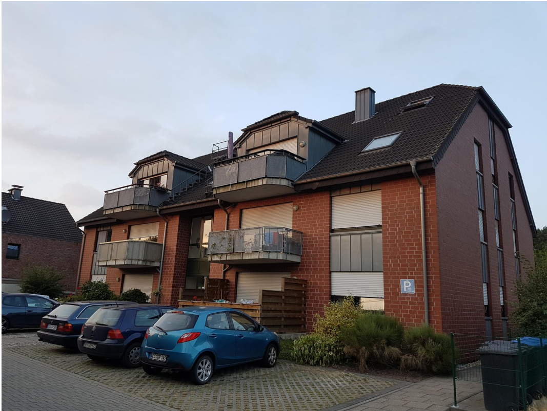
Haus von vorne