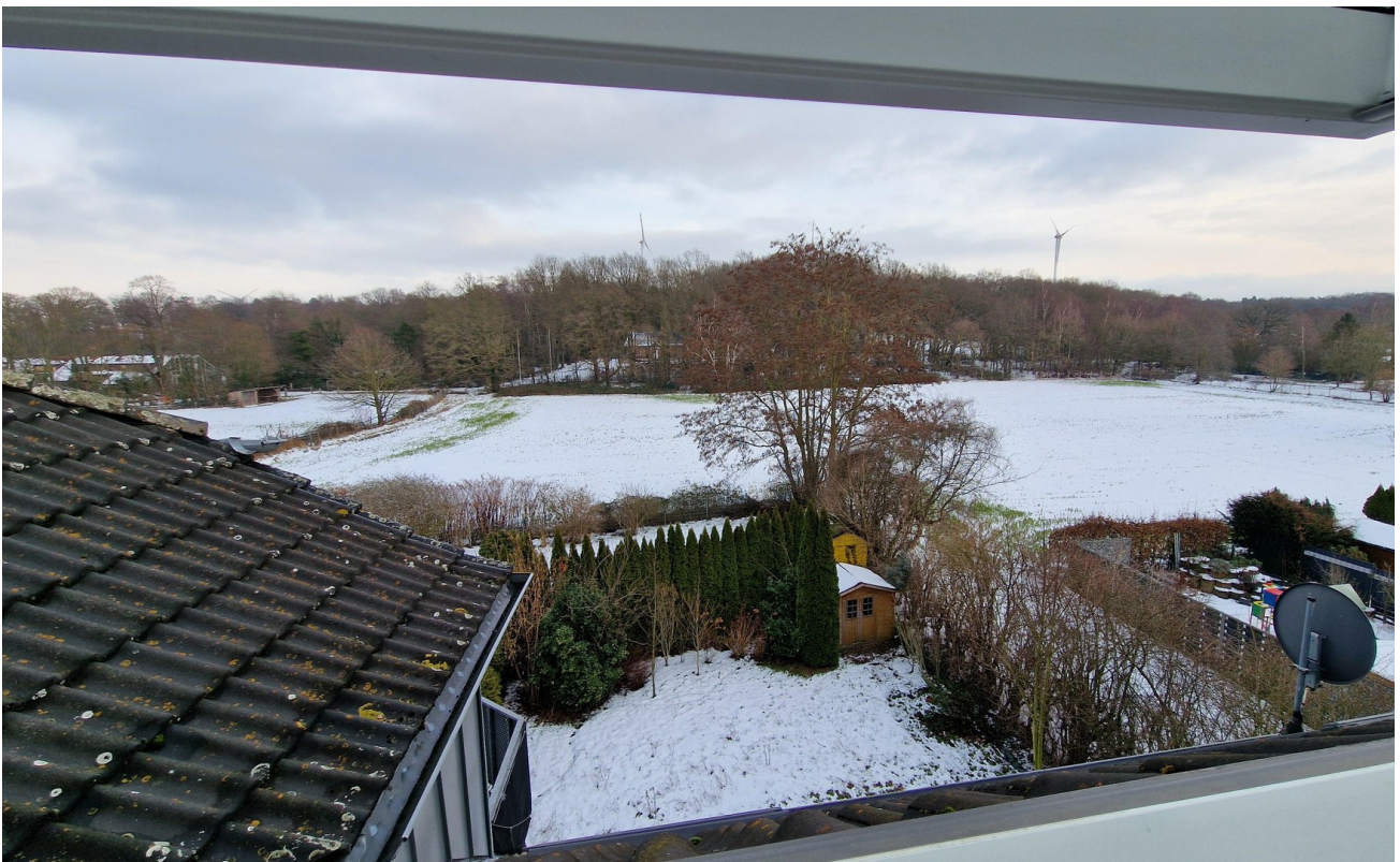
Blick aus dem Büro