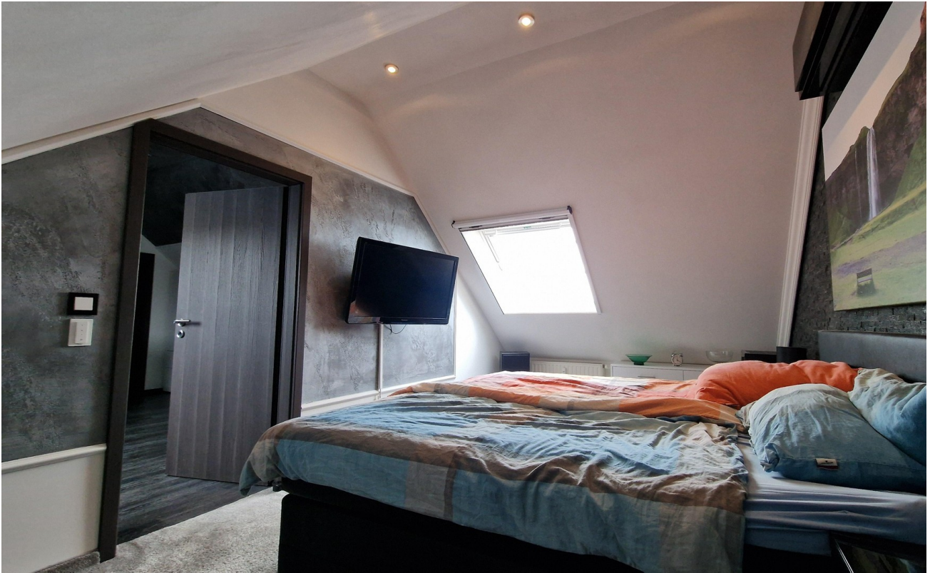
Schlafzimmer mit Klimaanlage