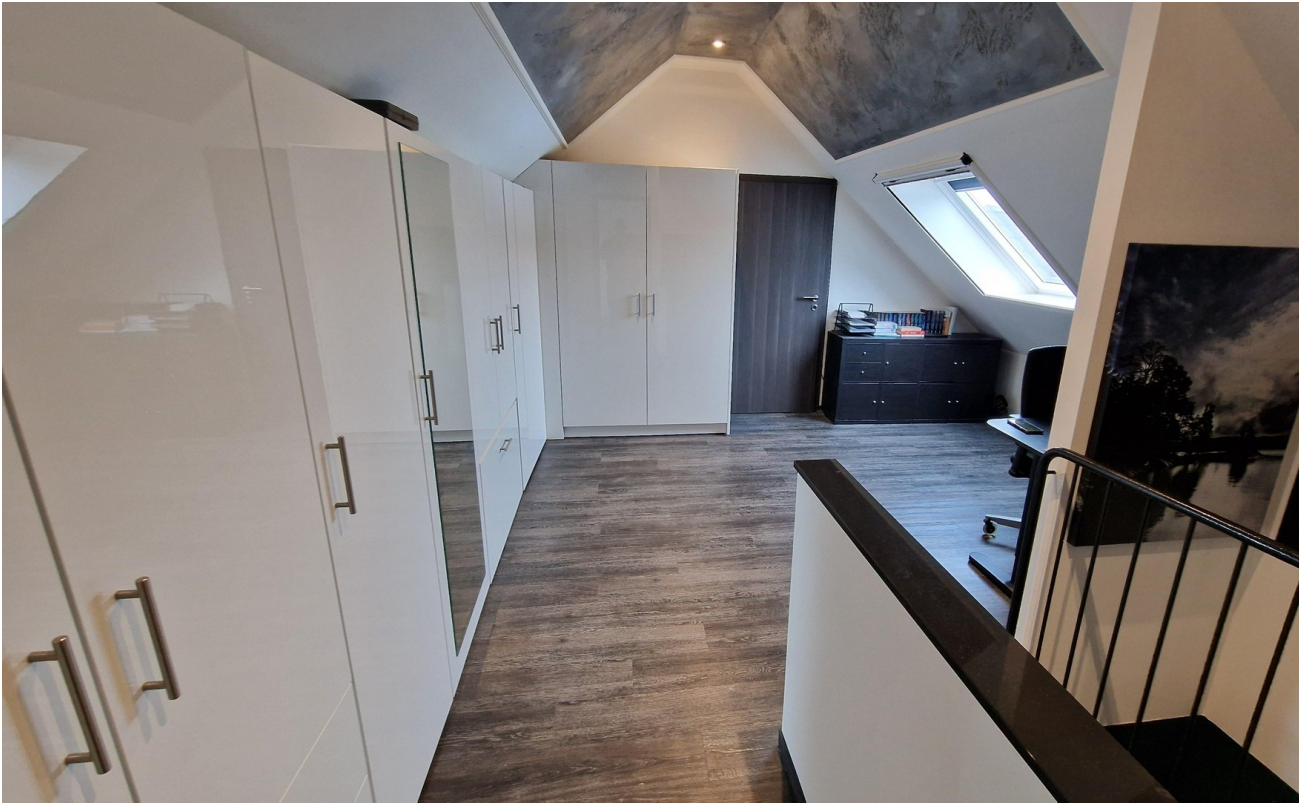
Büro und Ankleidezimmer