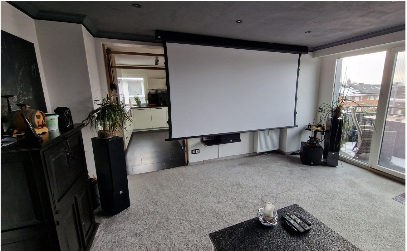
Heimkino mit autom. Leinwand