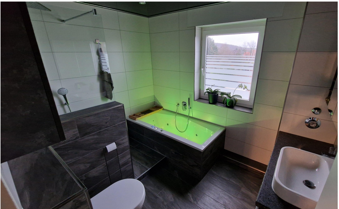
Mod. Badezimmer mit Whirlwanne