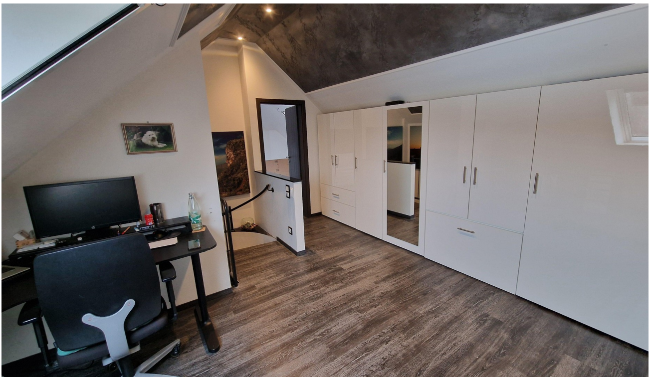
Büro und Ankleidezimmer