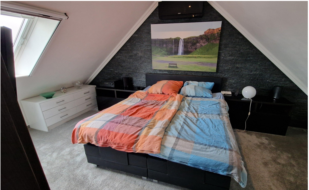
Schlafzimmer mit Klimaanlage