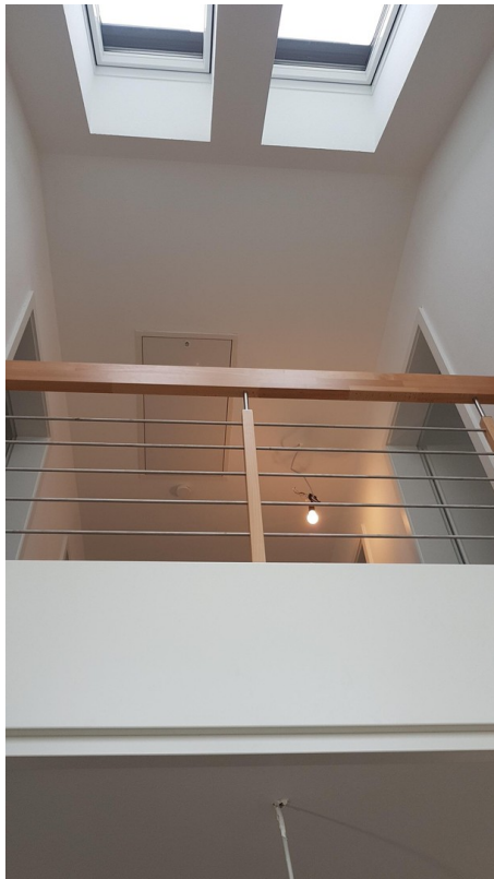
Blick zur Galerie