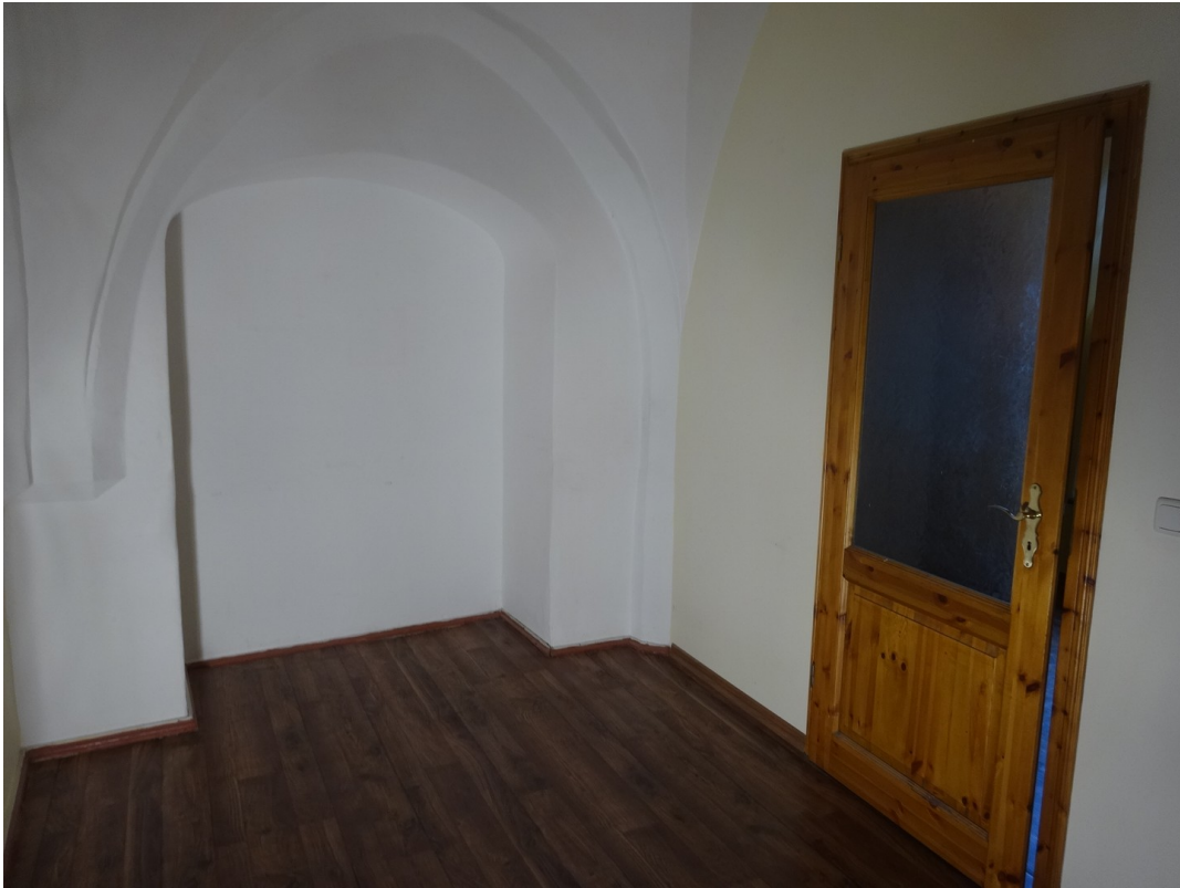
Blick zum Eßplatz in Küche