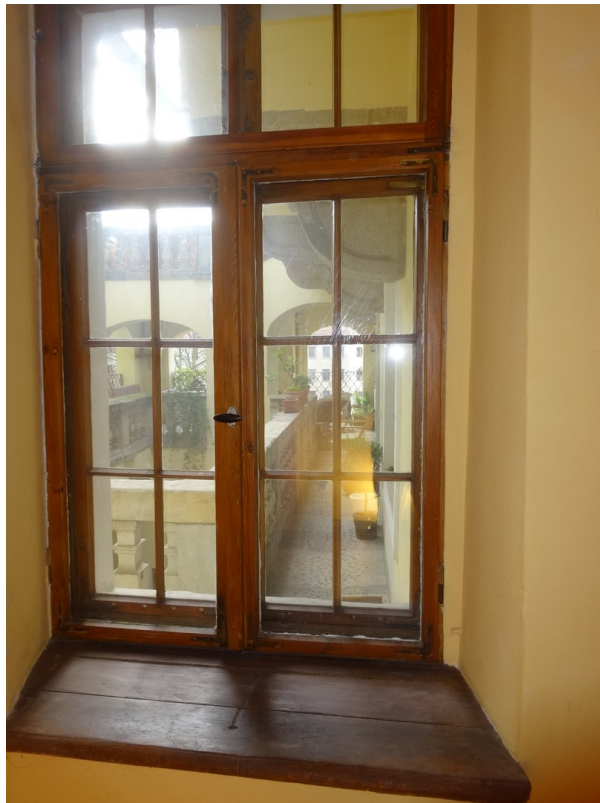
Ausblick zur Terrasse