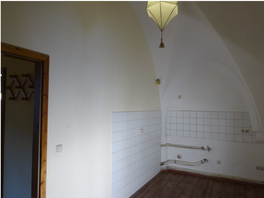
Kochecke in Küche