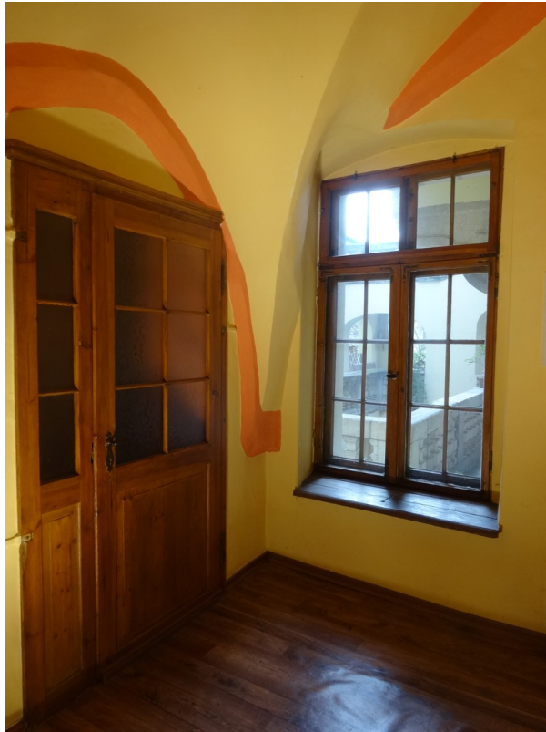
Diele mit Ausblick zu Terrasse