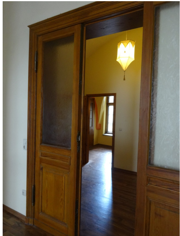
Blick vom Wohnzimmer in WE