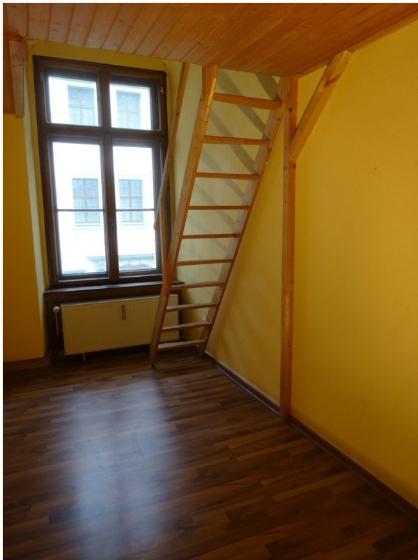
Blick in Schlafzimmer