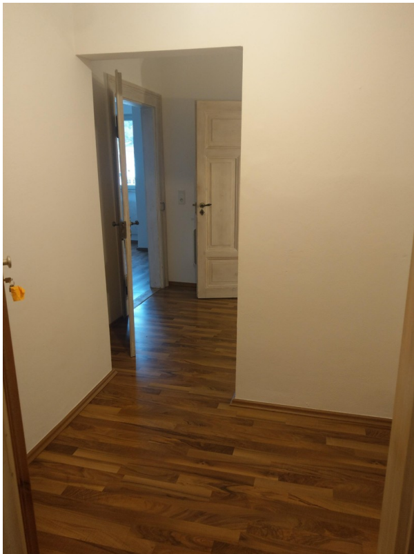
Flurbereich in der Mitte