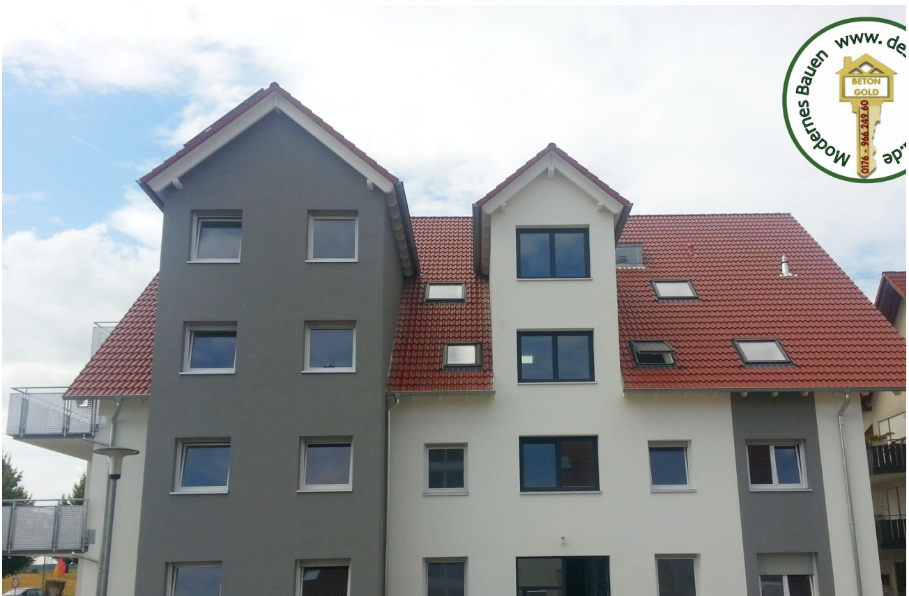
Eingang, Haller Ring 1