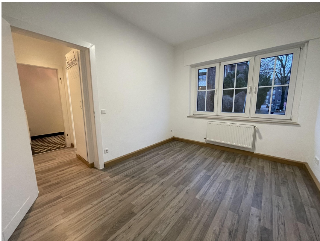
WG-Zimmer mit großem Fenster