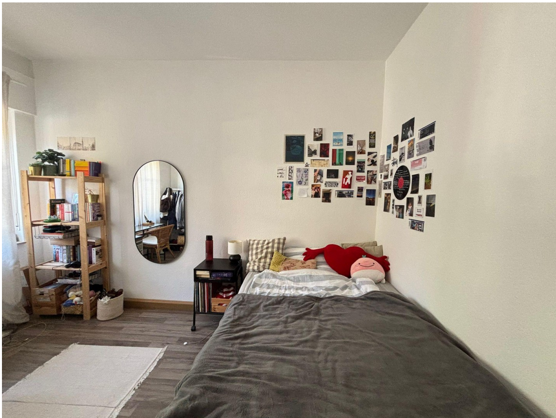
So kann es aussehen!