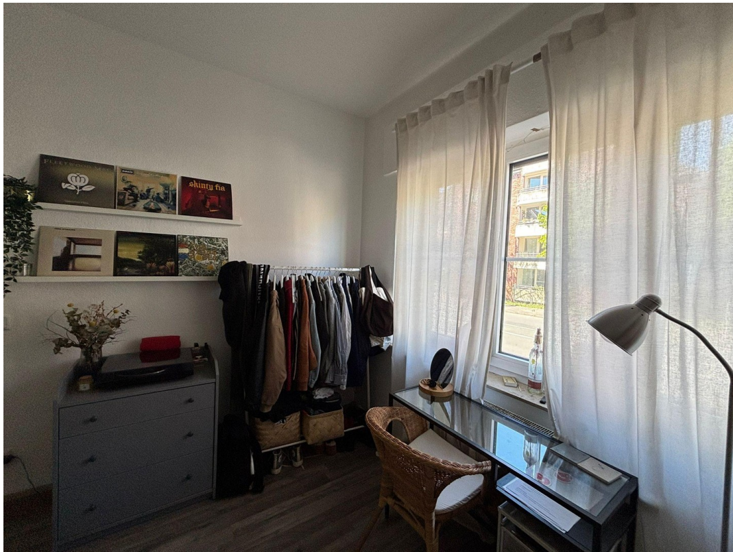
So kann es aussehen!