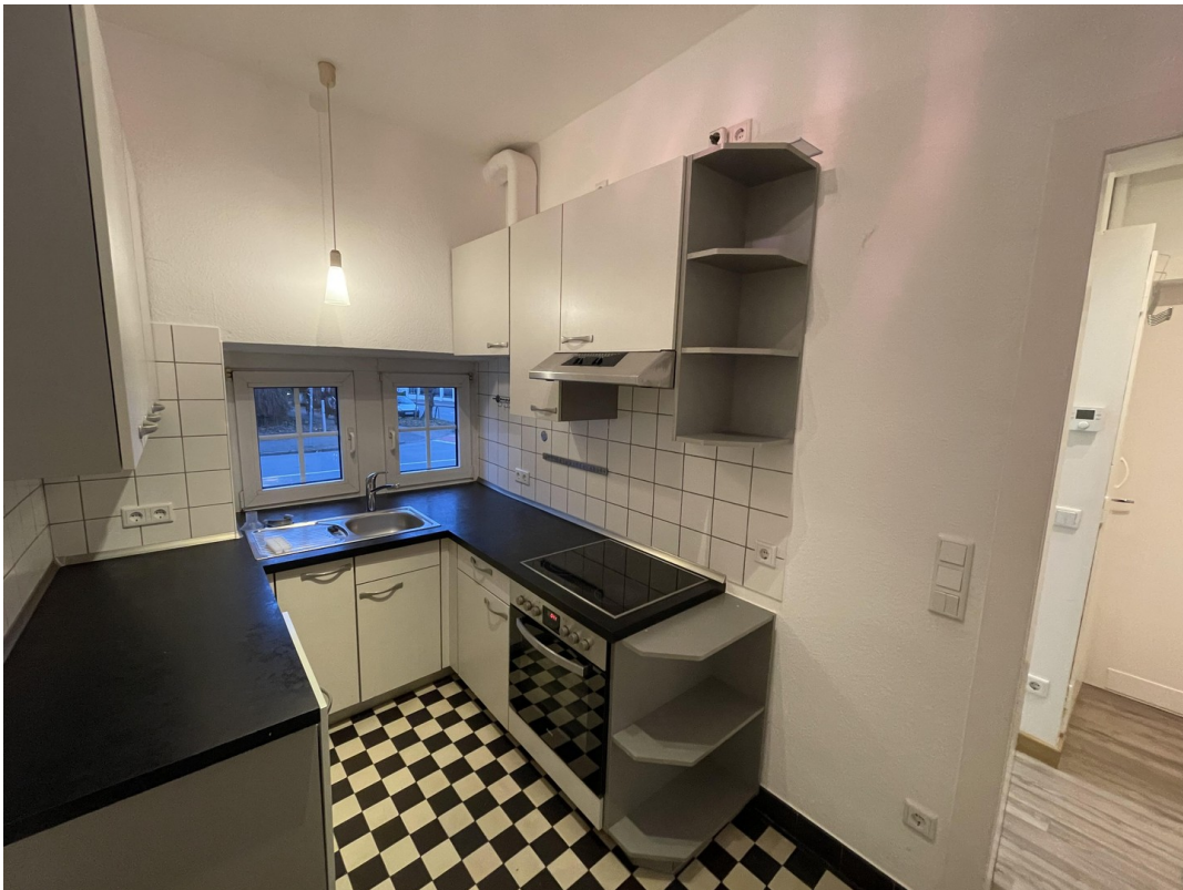
Küche mit Sitzmöglichkeit