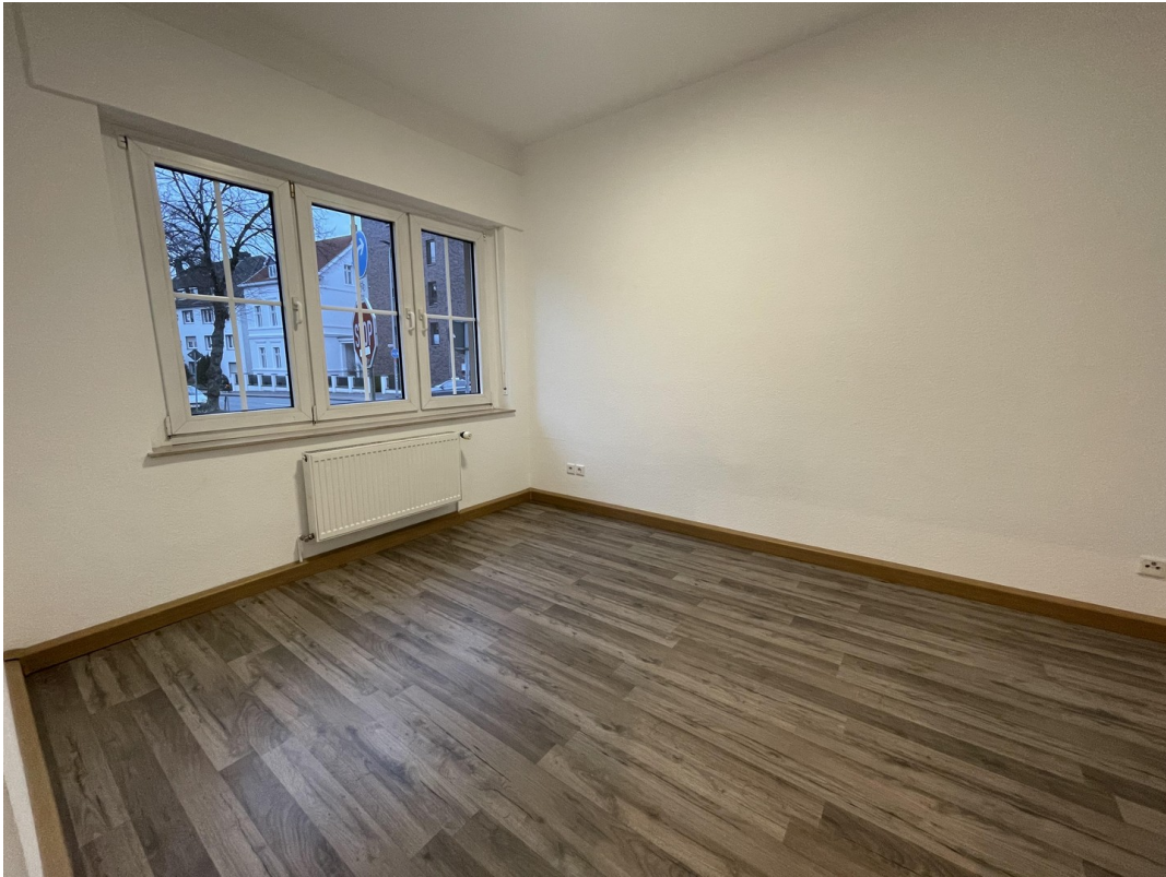
WG-Zimmer mit großem Fenster