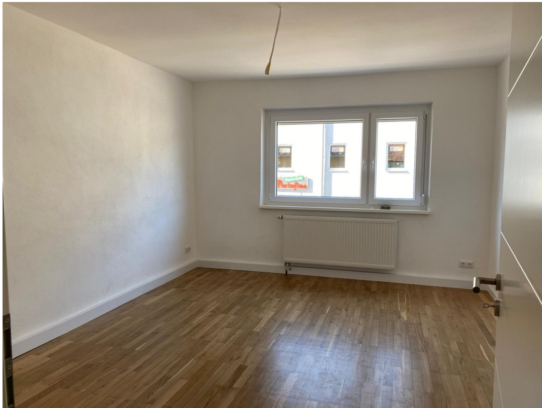
Schlafzimmer Richtung Straße