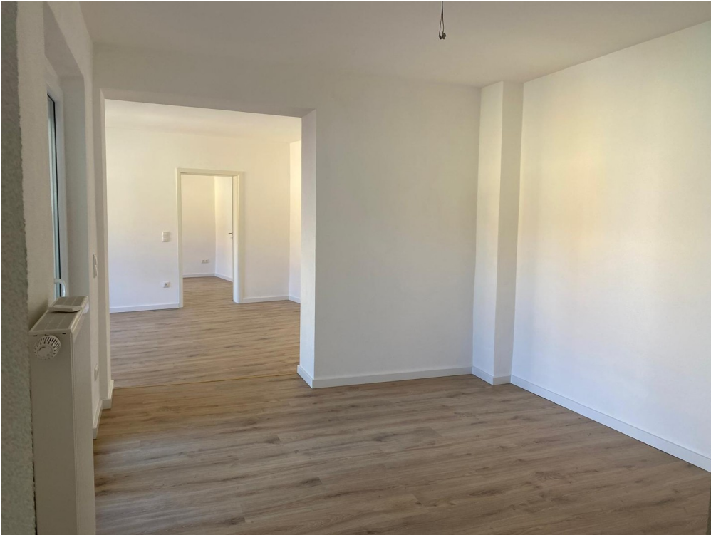
Blick aus dem Flur Richtung WZ