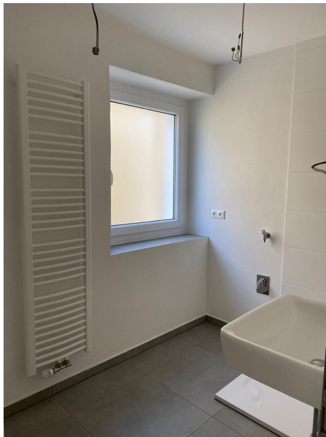
Bad mit Fenster und Dusche