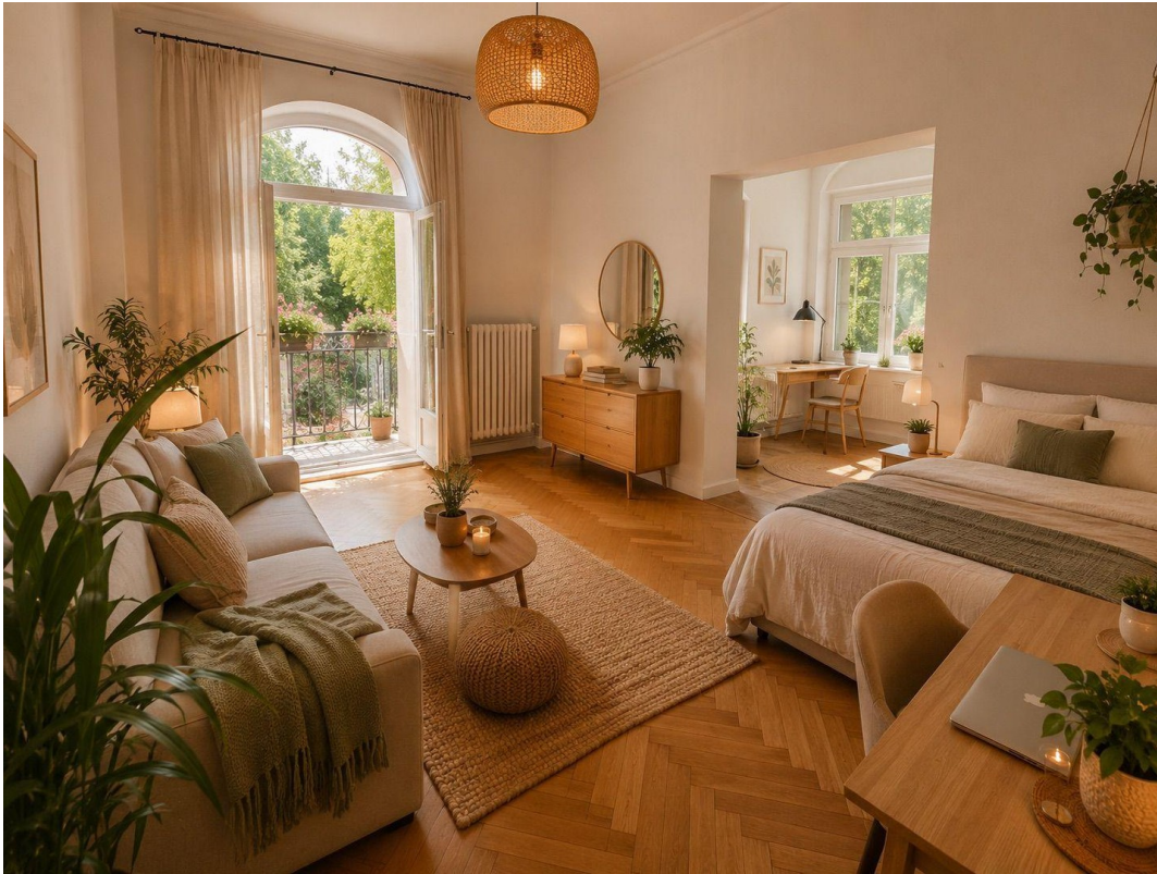
Wohnsuite № 2