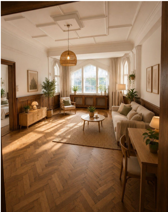
Wohnzimmer Suite № 3