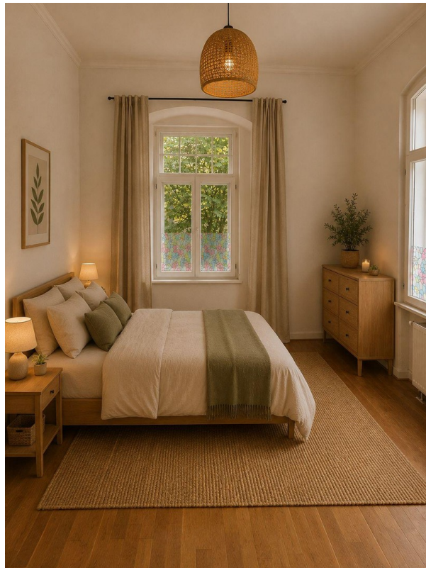
Schlafzimmer Suite № 4