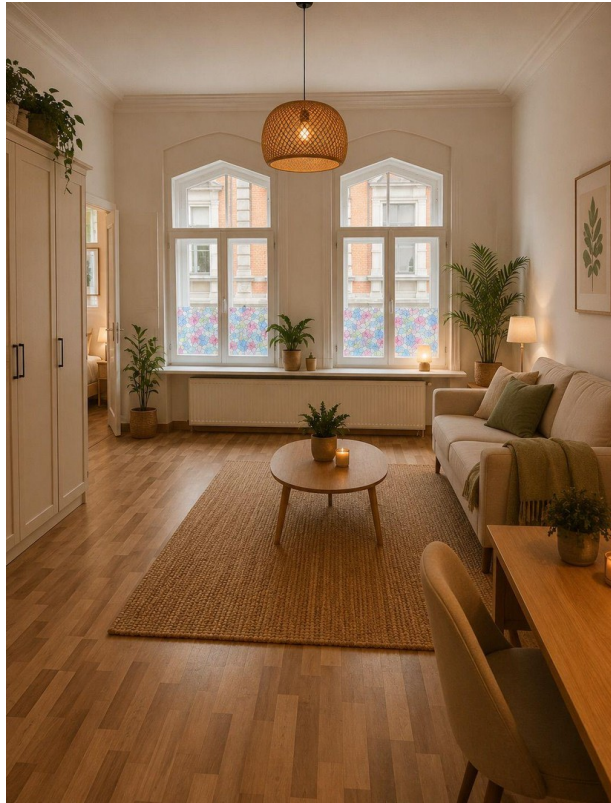
Wohnzimmer Suite № 4