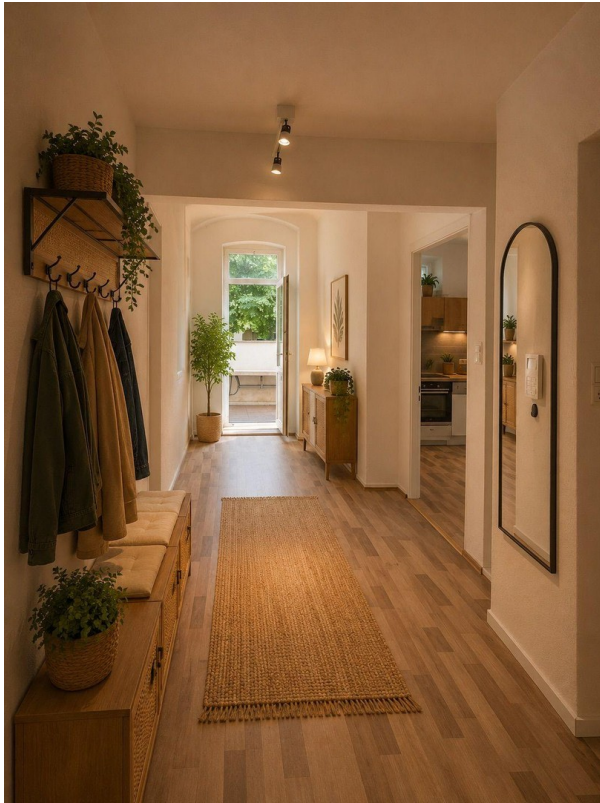
Flur zu Küche und Terrasse