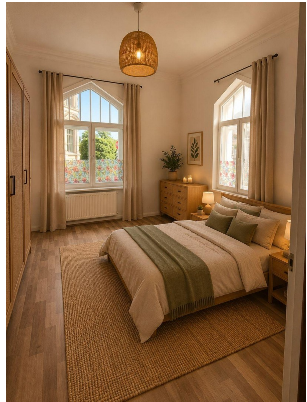
Schlafzimmer Suite № 3