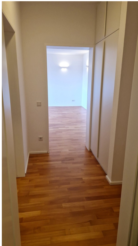
Flur vom Bad aus