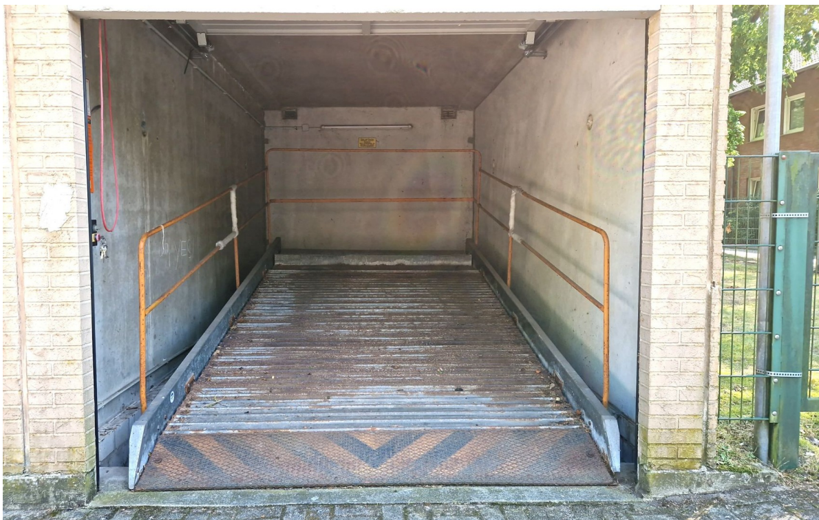
1 Platz in der Doppel-Garage