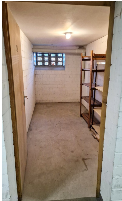
Kellerabteil (7 qm)