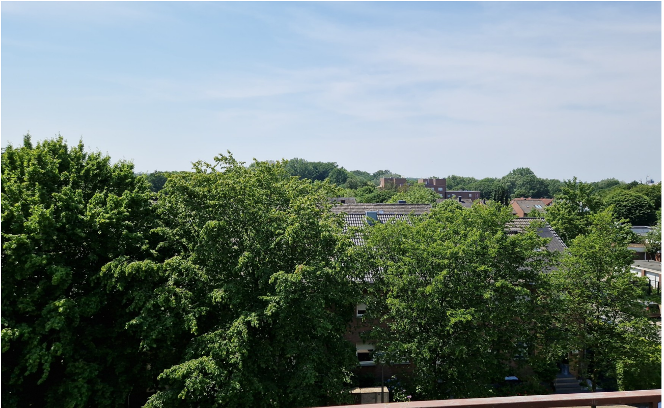
Ausblick vom Süd-West-Balkon