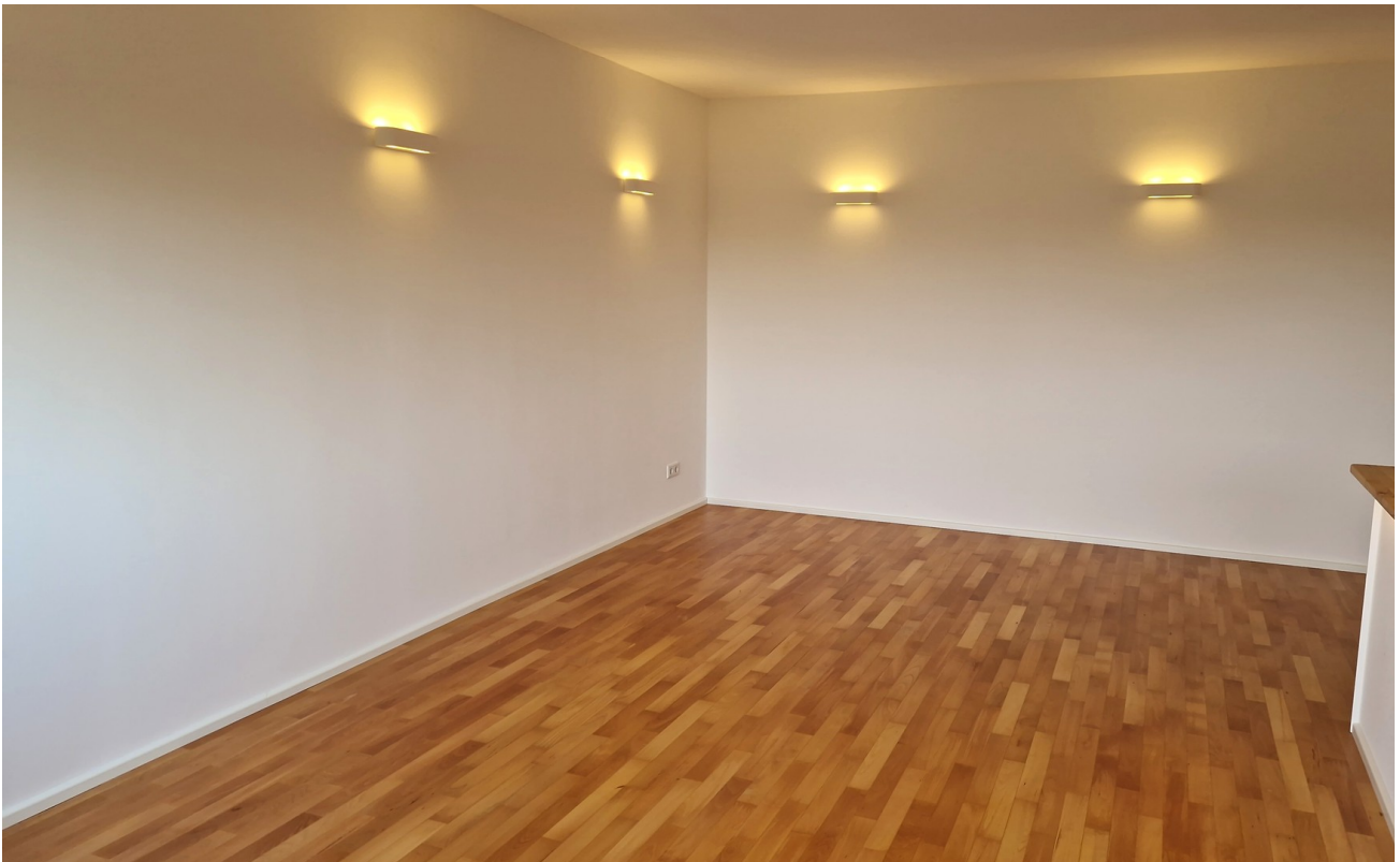
Wohnzimmer vom Balkon aus