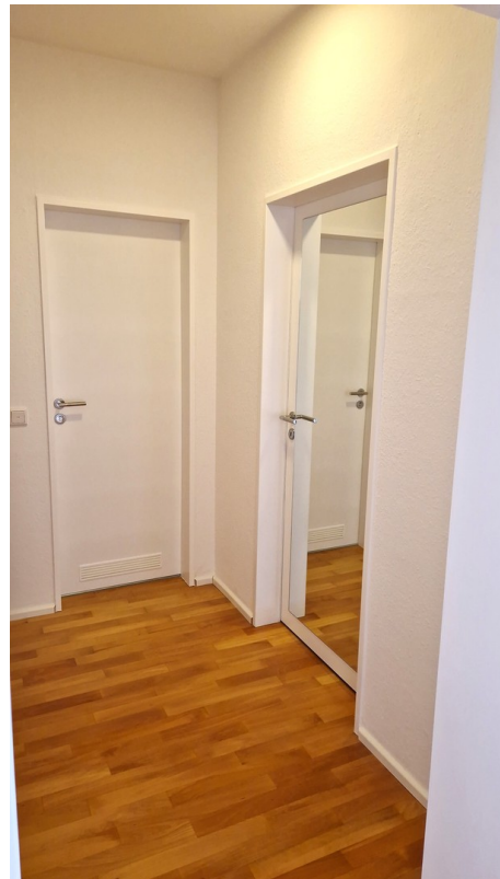
Flur vom Wohnzimmer aus