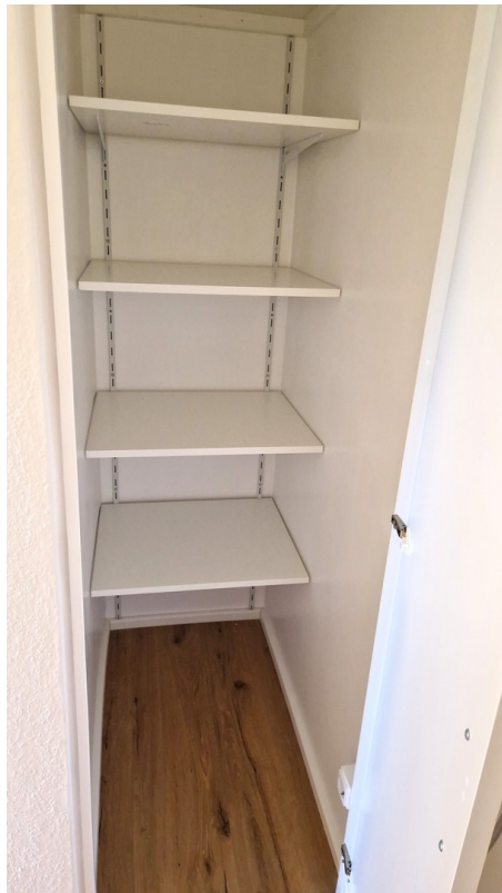
Abstellraum mit Regalsystem