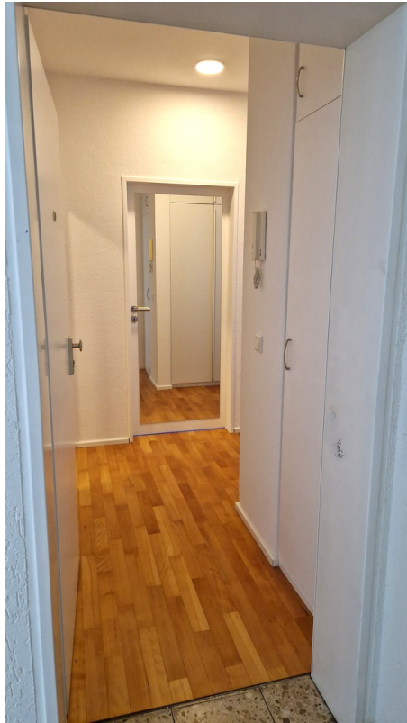
Flur vom Eingang aus