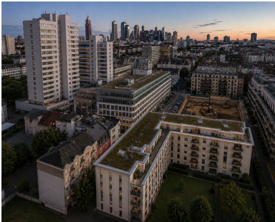
vor der Skyline Frankfurts