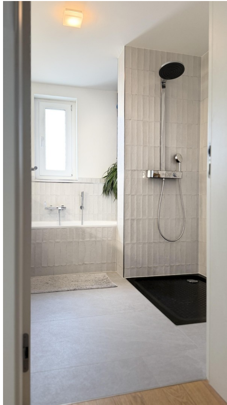
neues Bad (Duschkabine folgt)