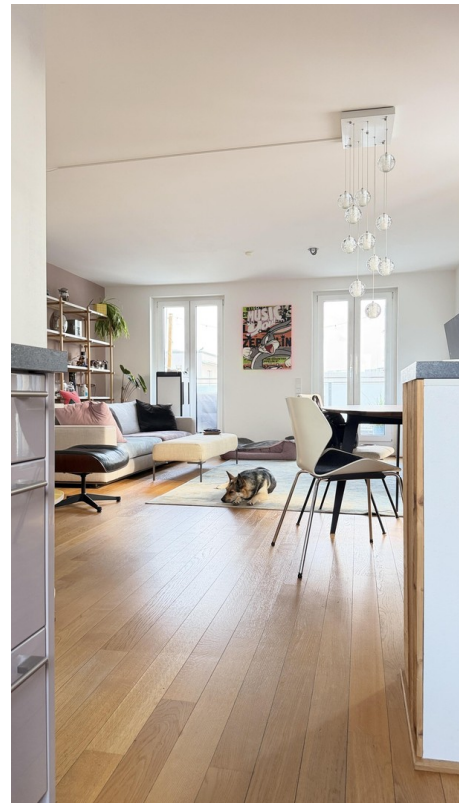
Blick aus Küche in Wohnbereich