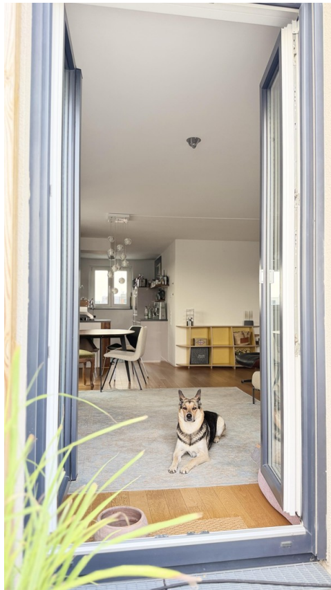
Blick von Balkon in Wohnbereich