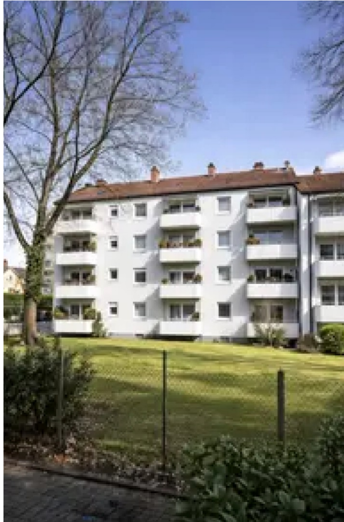
Hausansicht - Blick Zimmer