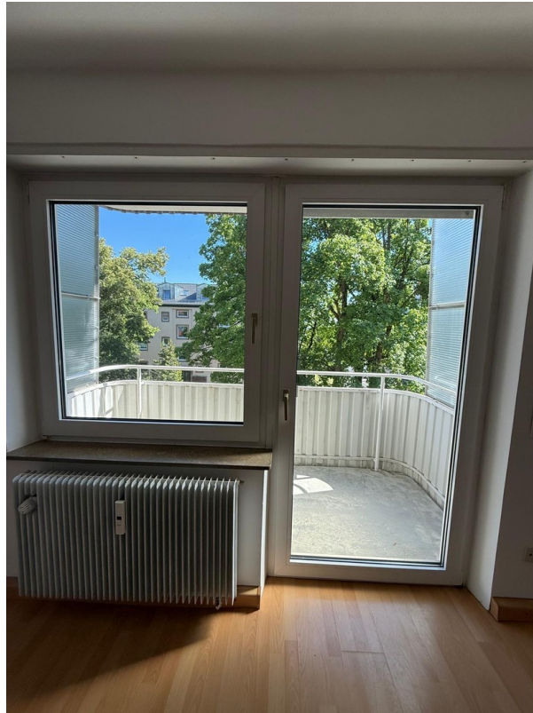
Blick auf Balkon