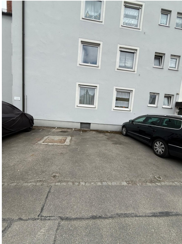
Stellplatz vor Haus