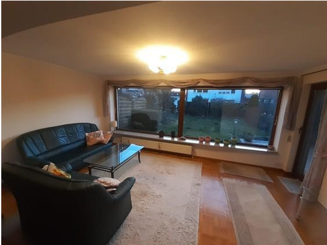
Wohnzimmer mit Gartenblick