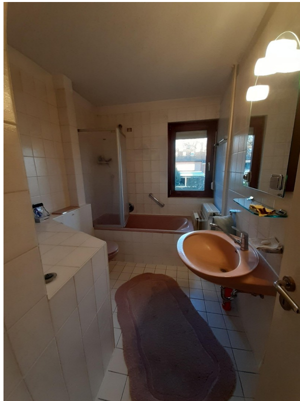
Badezimmer mit Fenster