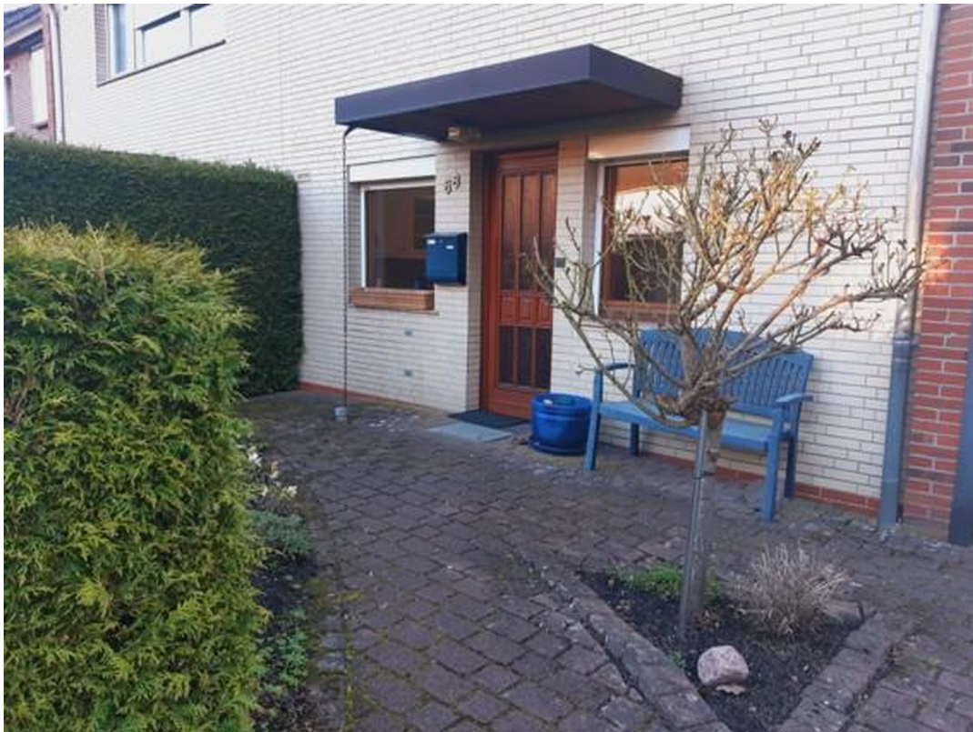
Eingang mit kleinem Vorgarten