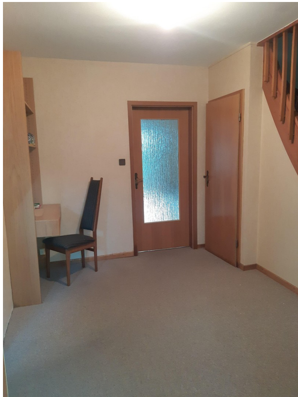
Diele im EG