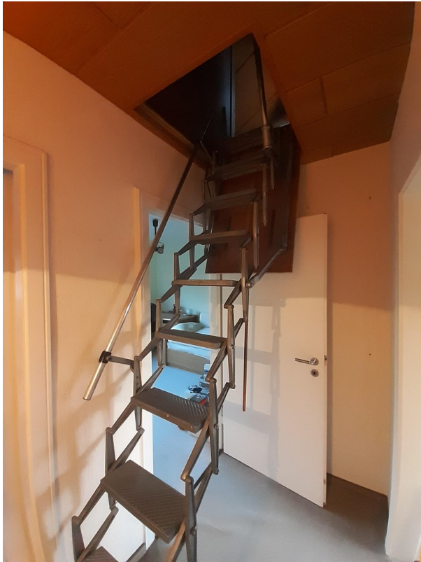
Ziehtreppe zum Dachboden