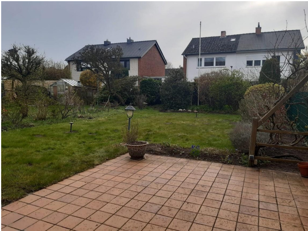
Terrasse und Gartenblick