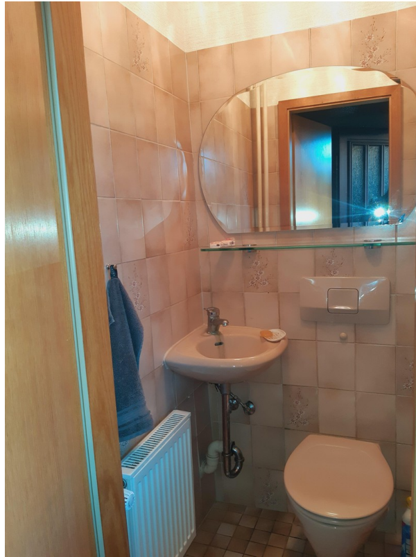
Gäste WC im EG