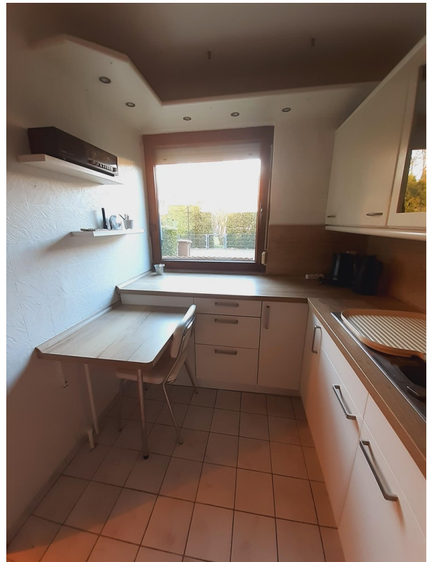
Küche mit viel Stauraum