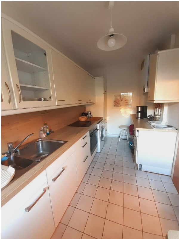
Küche mit viel Stauraum