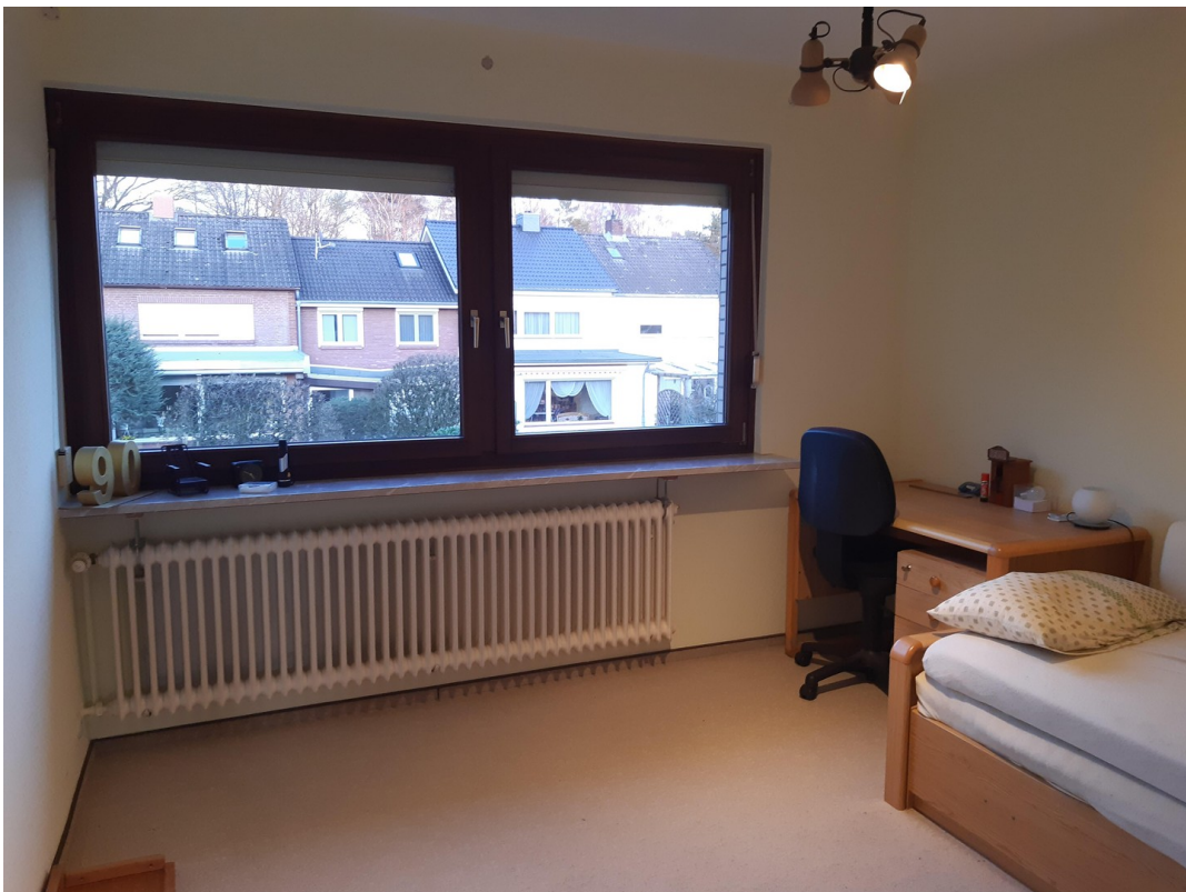
Helles Schlafzimmer 2