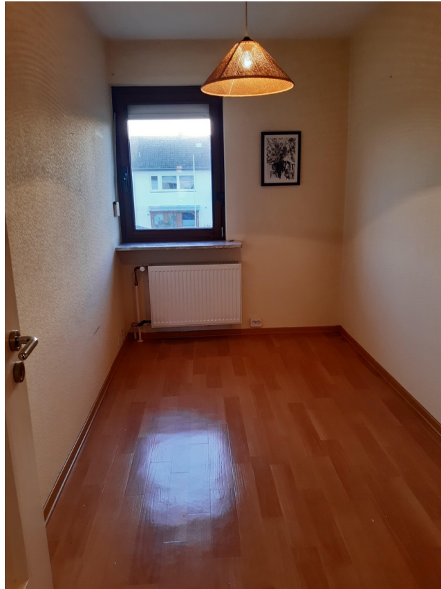
Kleiner zusätzlicher Raum OG