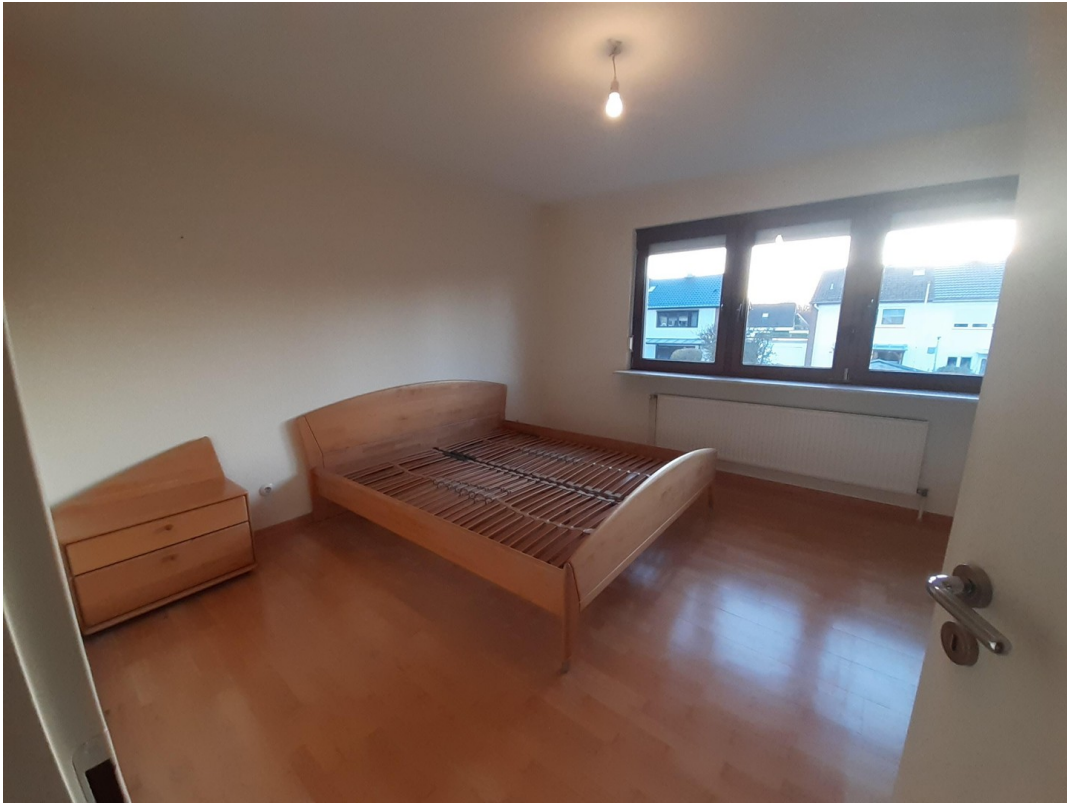
Helles Schlafzimmer 1