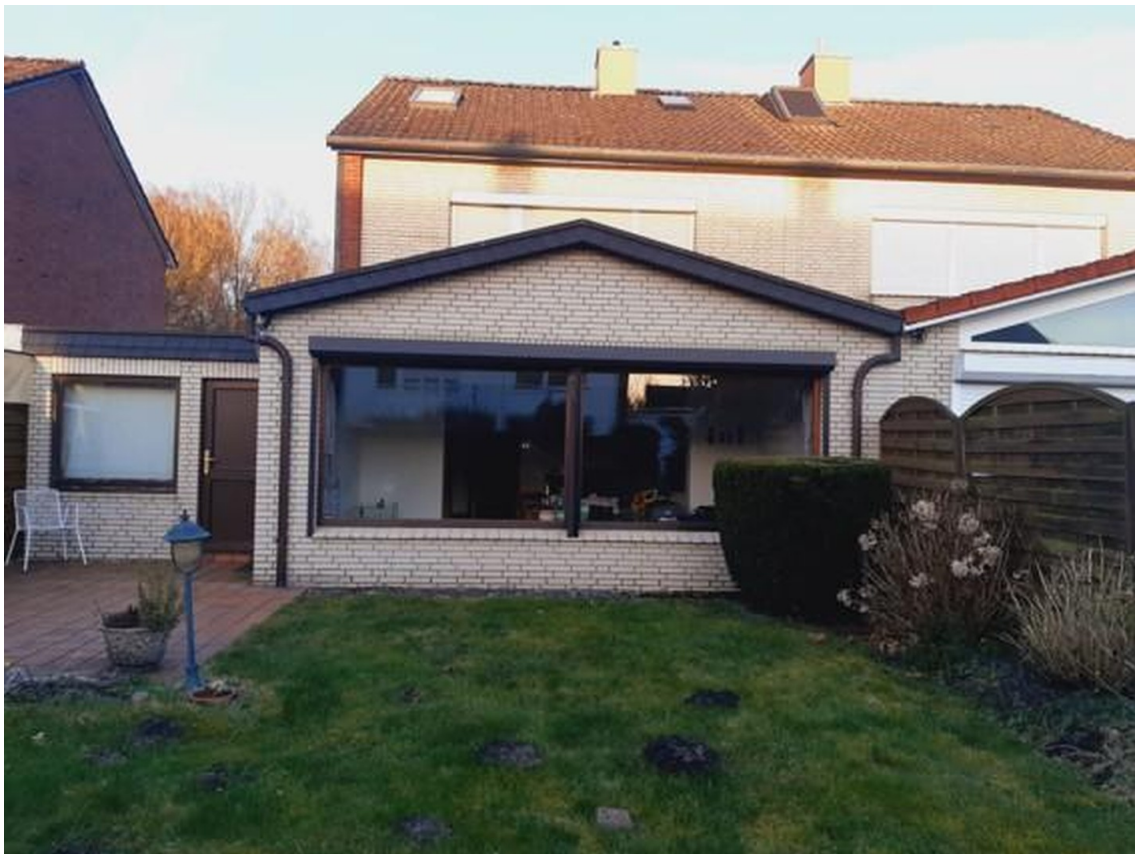
Hintere Hausansicht mit Garten