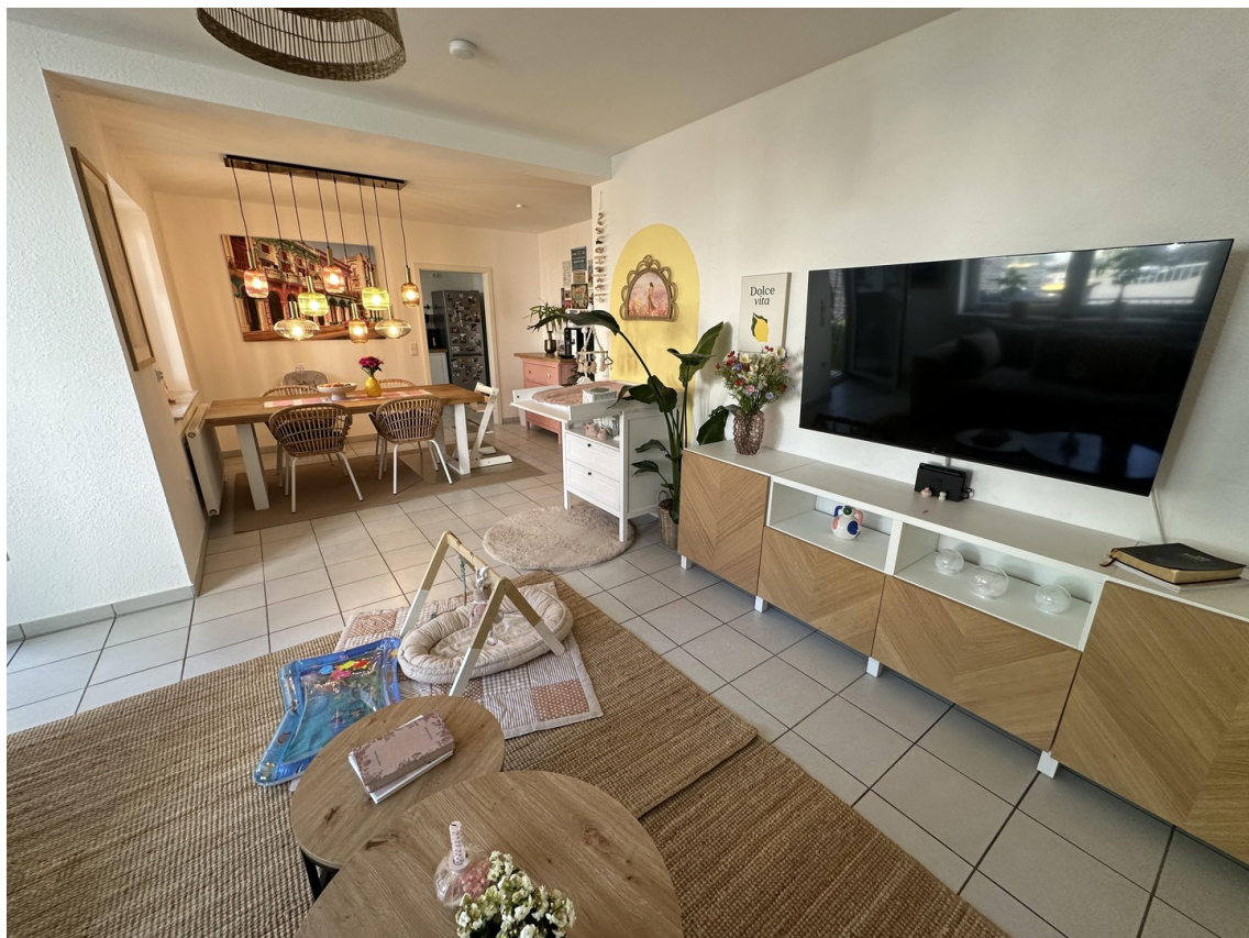
Wohnzimmer mit Esszimmer