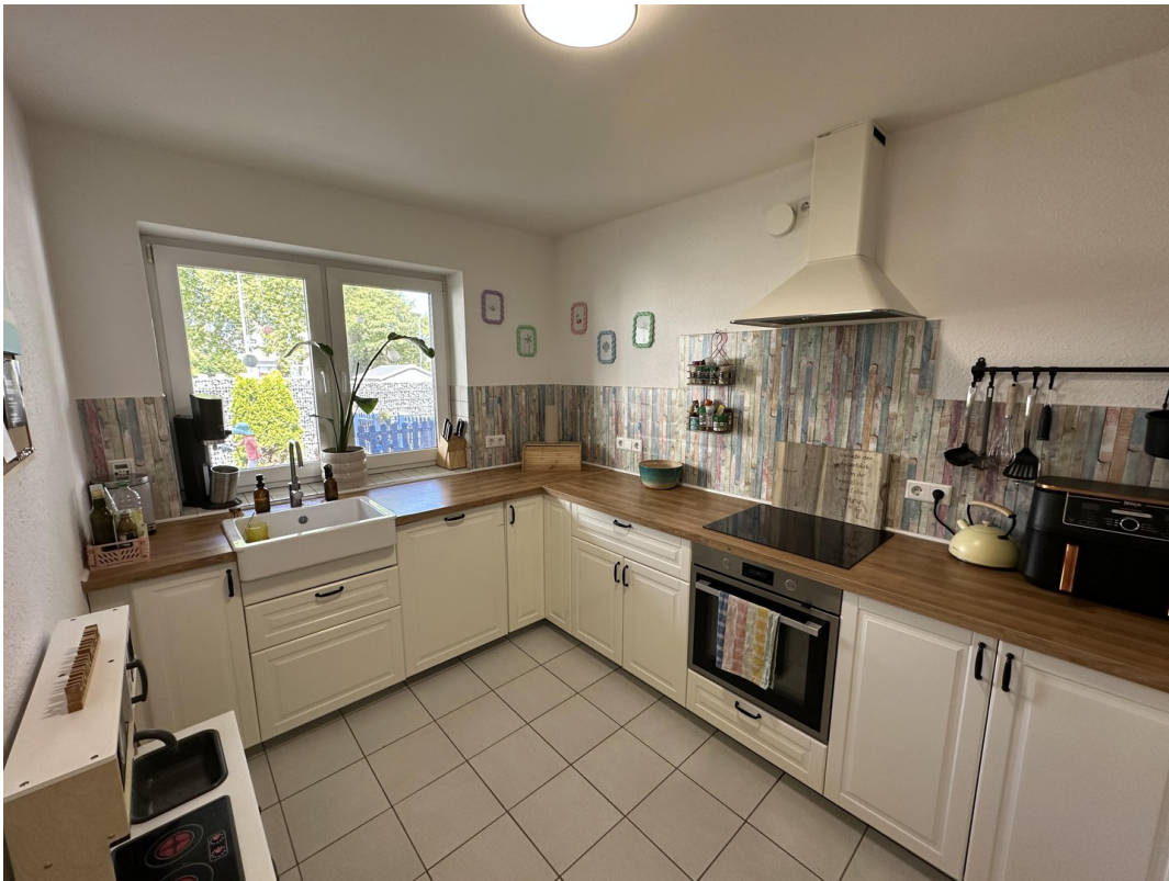
Einbauküche (Eigentum Mieter)