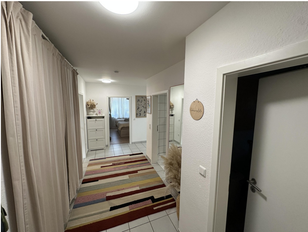
Flur aus Richtung Eingangstür