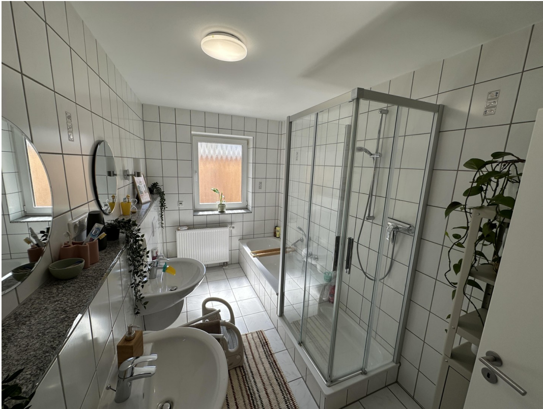
Bad mit Dusche und Badewanne