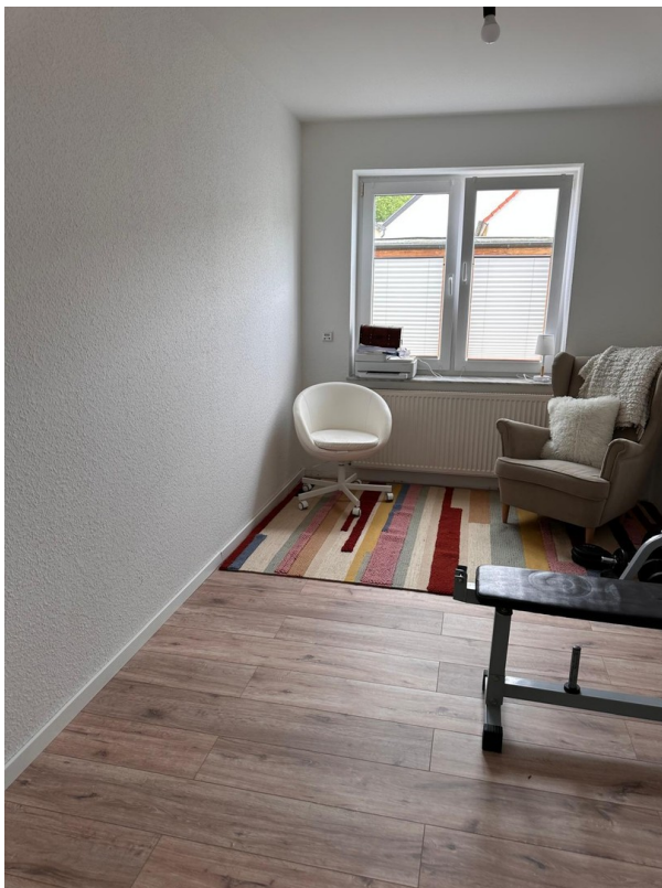
Kinderzimmer 1 - Home Office