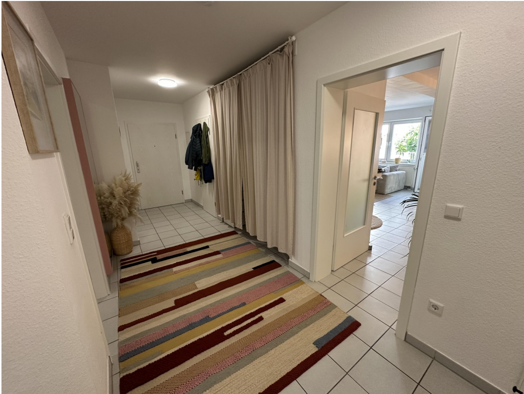
Flur in Richtung Eingangstür