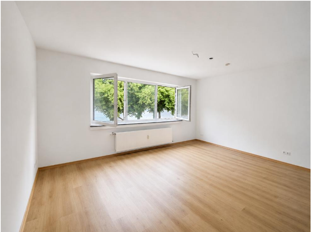
Wohnzimmer mit Rheinblick