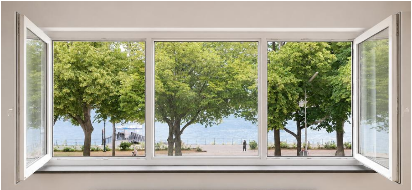
Blick aus dem Wohnzimmer

Direkt am Rheinufer, nur wenige Schritte von der Kennedybrücke entfernt, werden in einem gepflegten Mehrfamilienhaus mehrere helle Wohnungen neu vermietet. Jede Wohnung bietet auf 62 m 2 einen durchdachten Schnitt mit Wohnzimmer, zwei weiteren Zimmern, Küche, Bad und eigenem Balkon. Die drei Etagenwohnungen sind in Aufteilung und Ausstattung weitgehend vergleichbar.