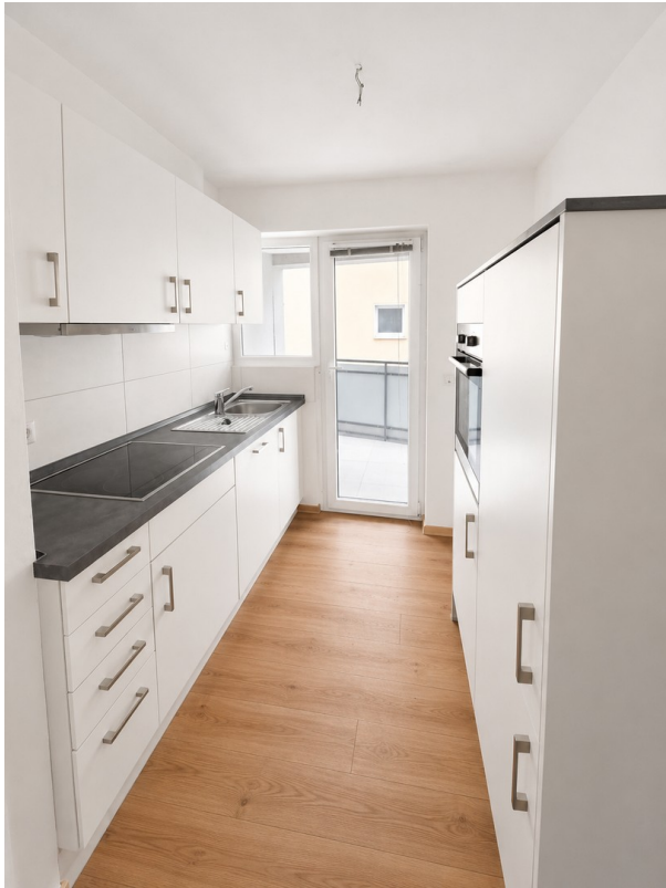
Küche + Zugang zum Balkon