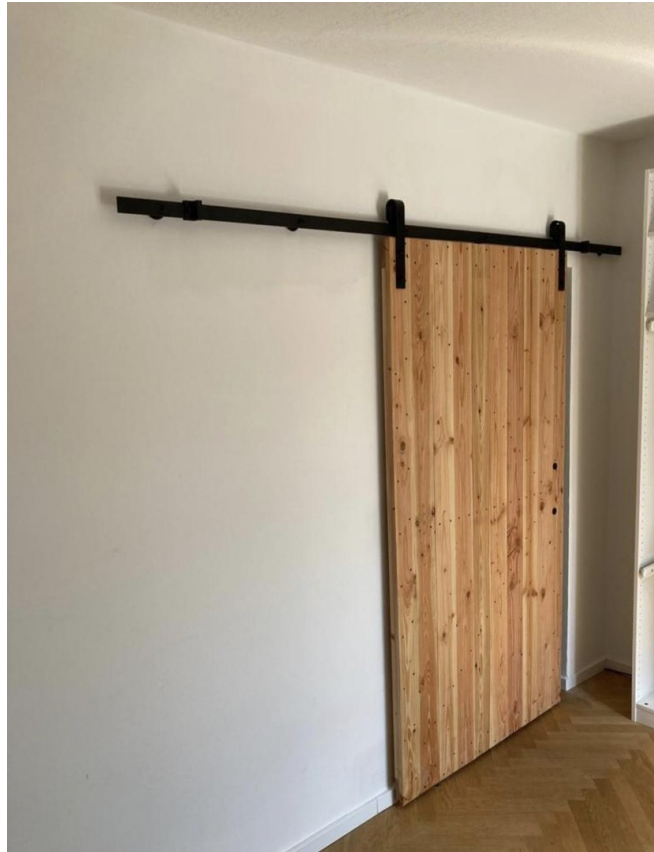
Schiebetür Ansicht Schlafz.