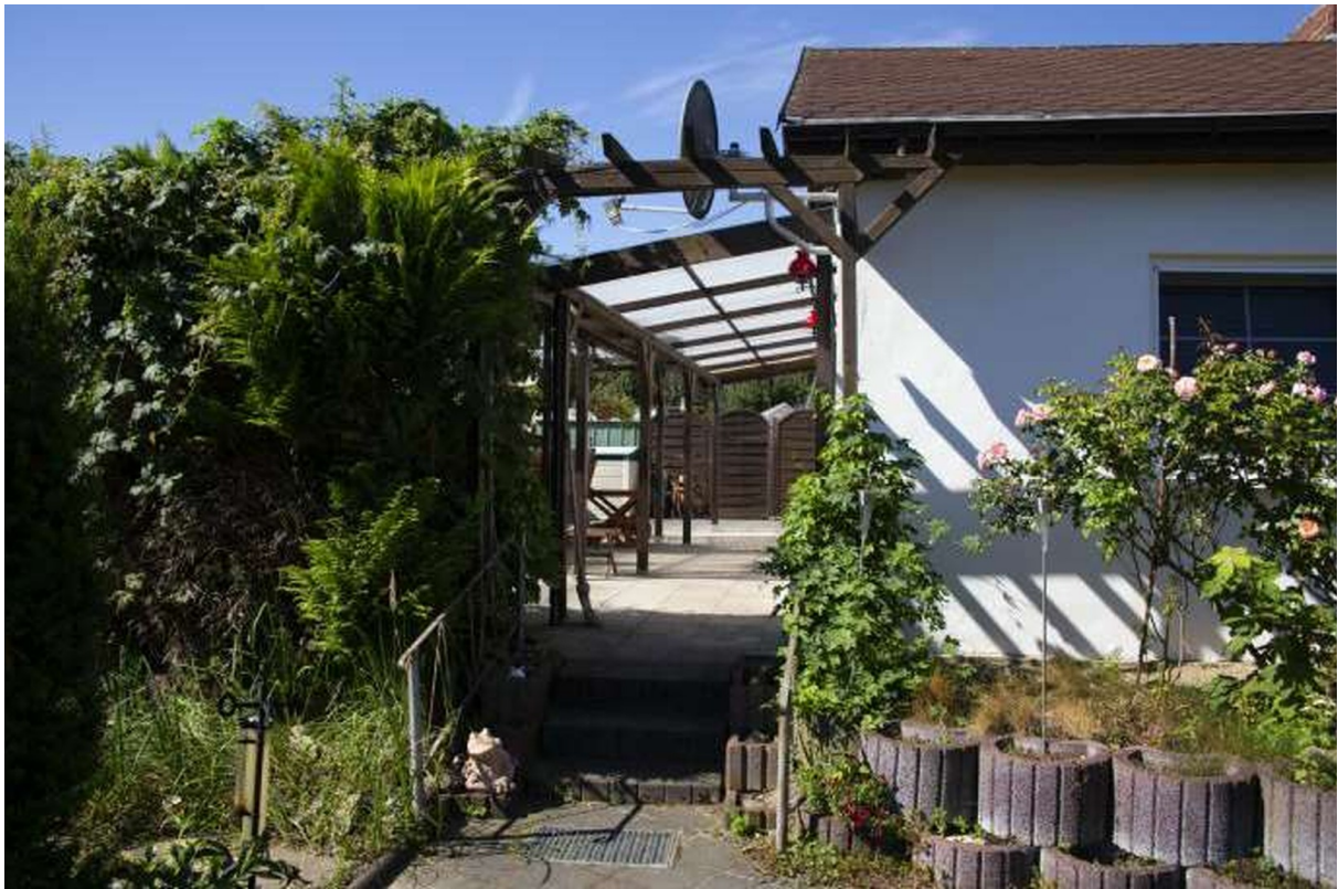
Treppe zur Terrasse