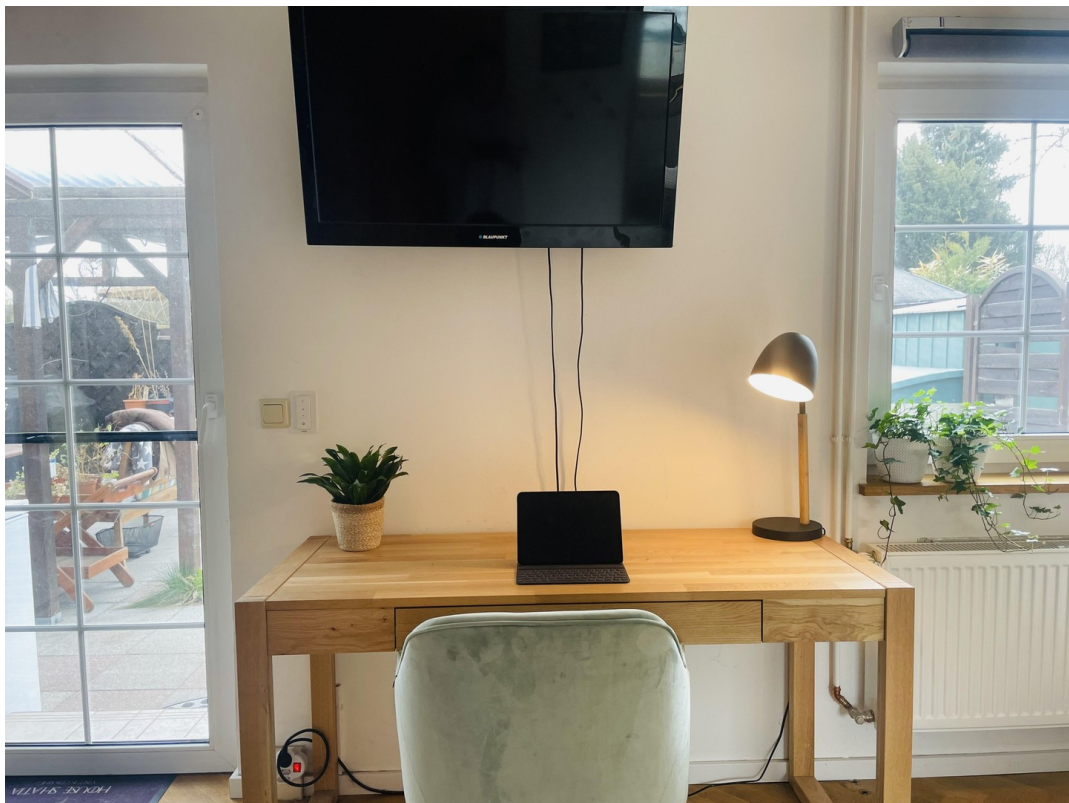
Schlafzimmer 1 Terrassentür