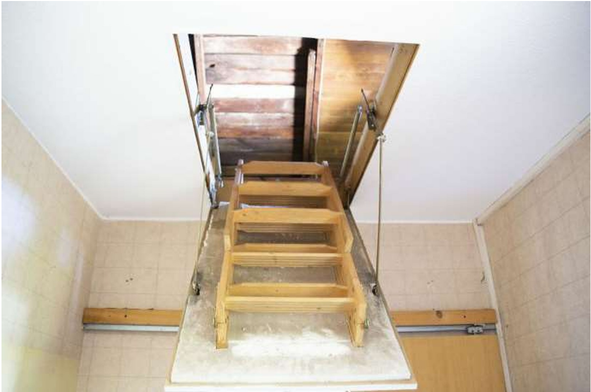
Treppe zum Dachstuhl