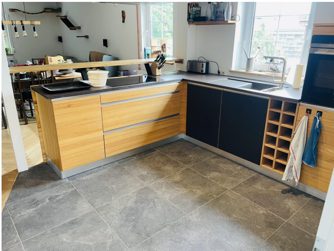
Team 7 Küche