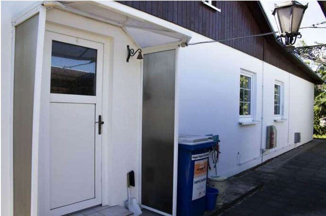
Eingang zum HWR