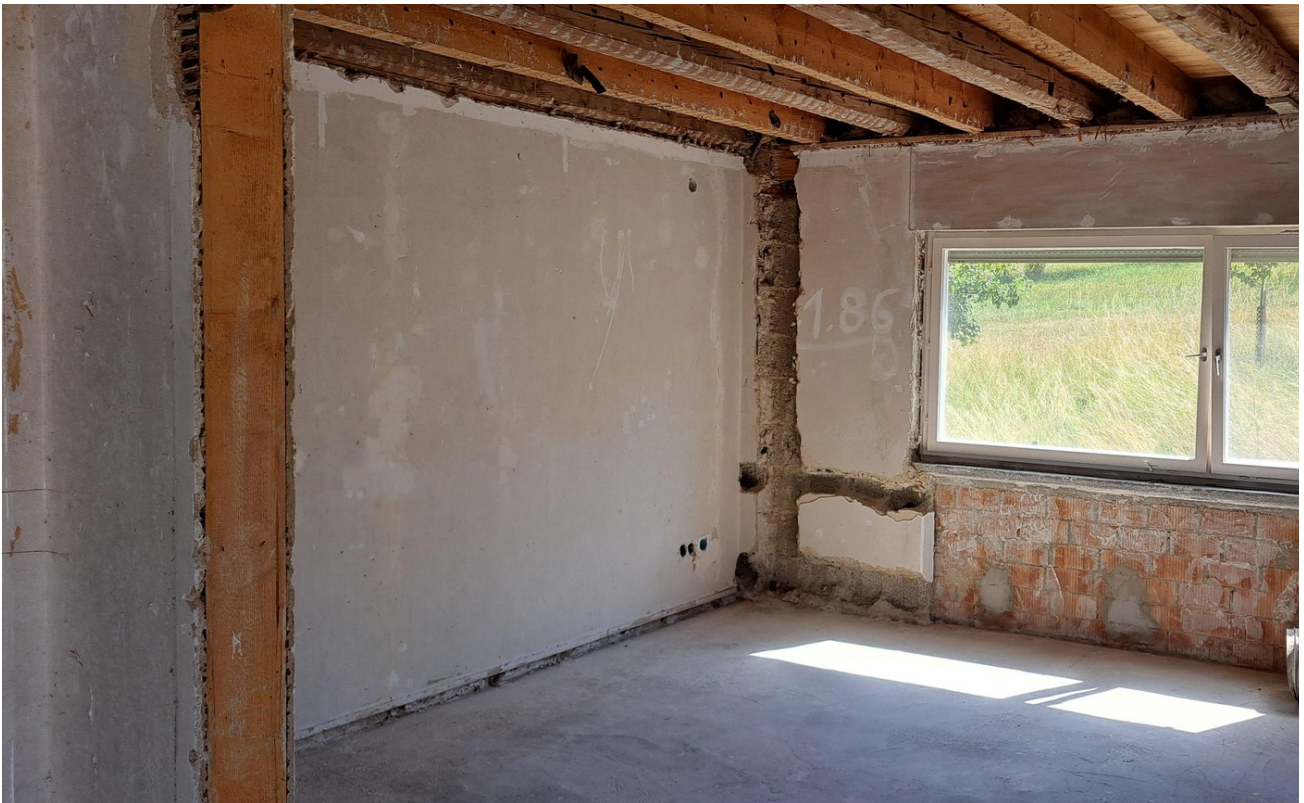
1 Stock WH rechts WZ