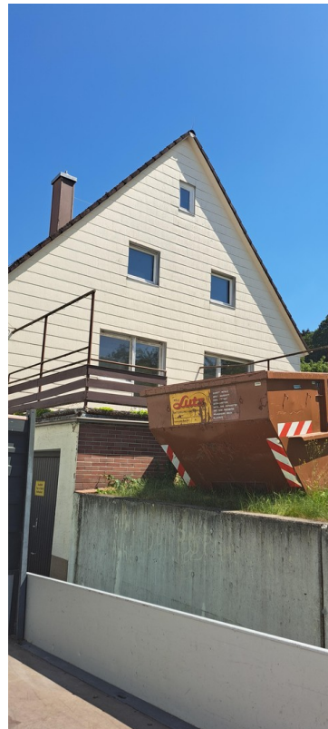
Rechte Seitenansicht zum Garten