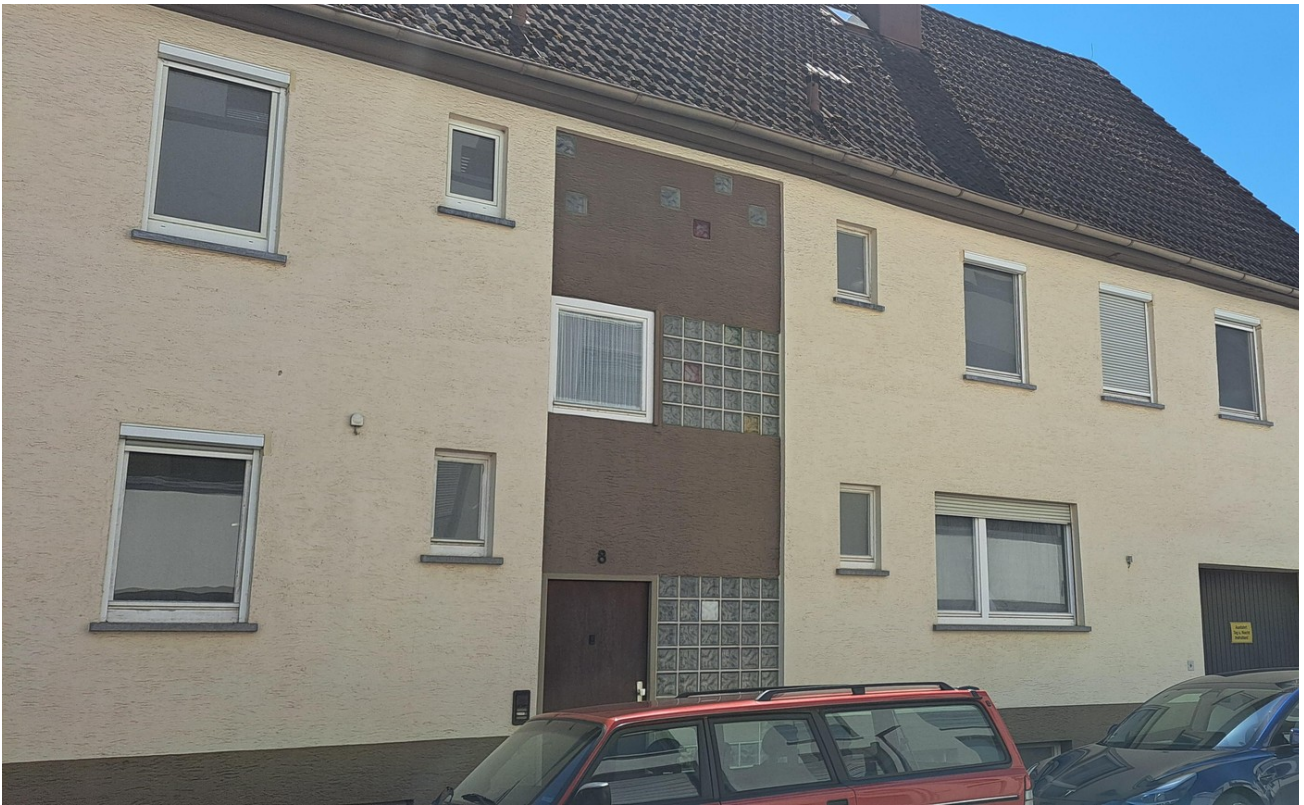
Vorderseite Eingang Wohnhaus