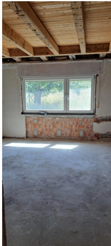
1 Stock WH rechts WZ