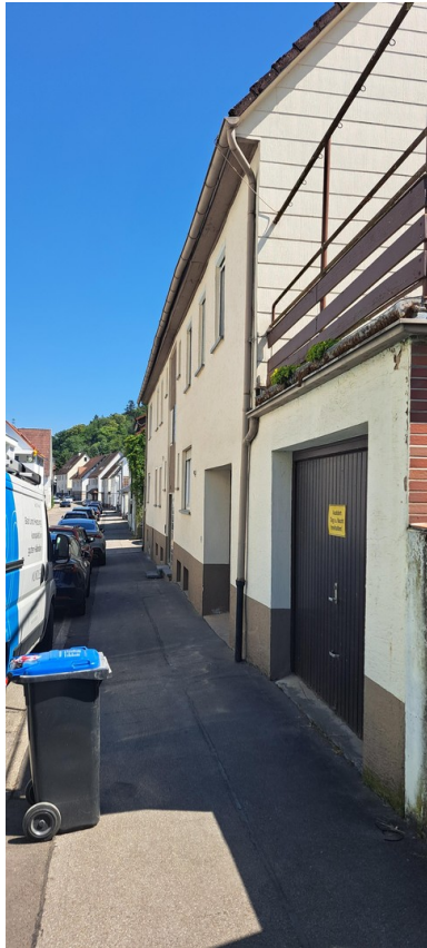
Vorderseite Eingang Garagen