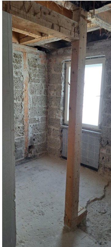
1 Stock WH rechts Bad