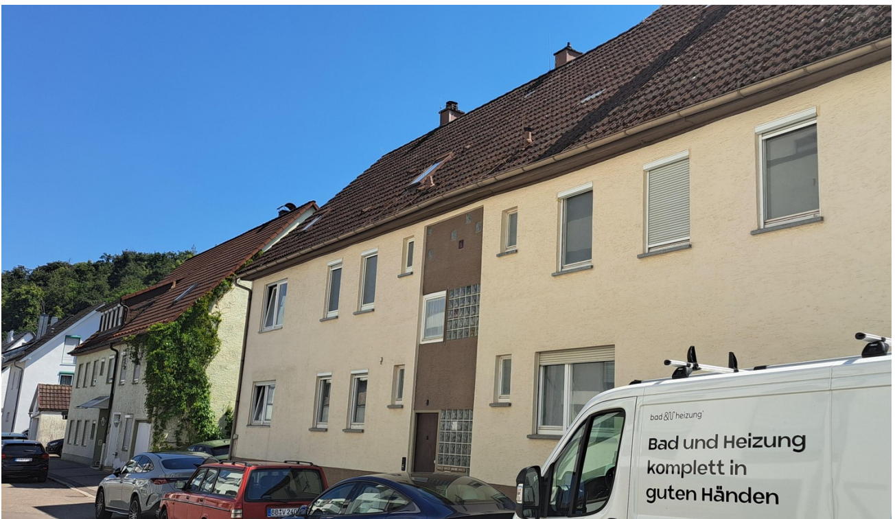
Vorderseite Eingang Wohnhaus