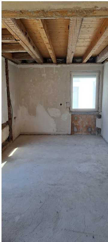
1 Stock WH rechts Esszimmer