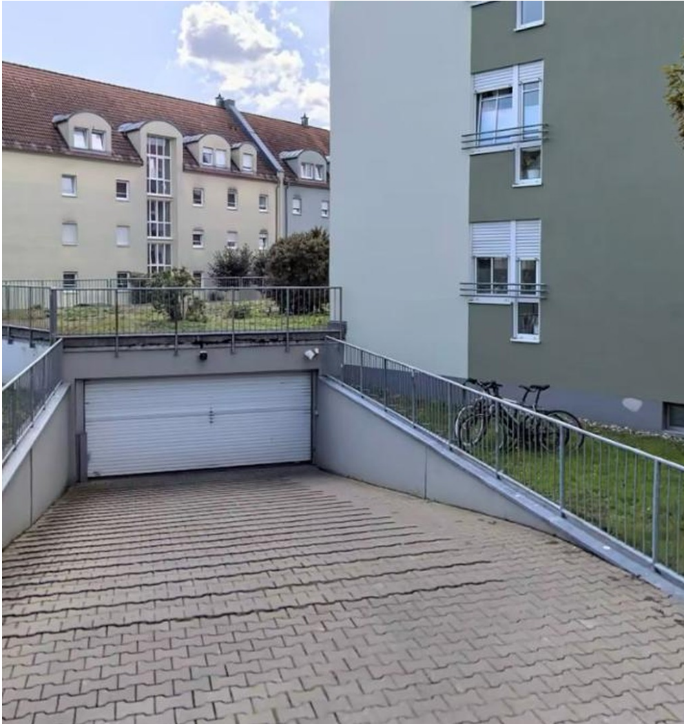
Einfahrt zur Tiefgarage