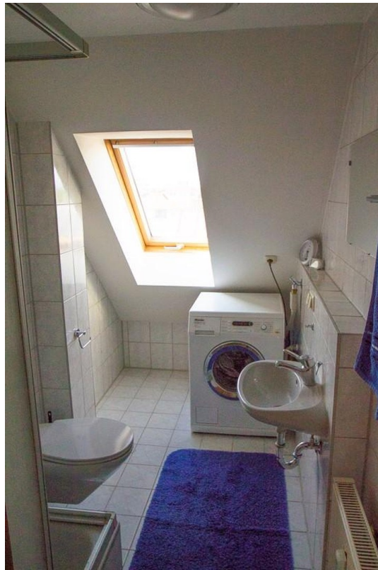
Bad mit Waschmaschinenanschluss