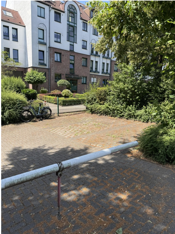
PKW-Stellplätze vor dem Haus