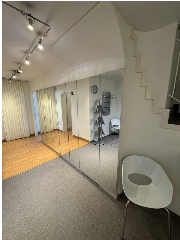
Einbauschränke mit Spiegel