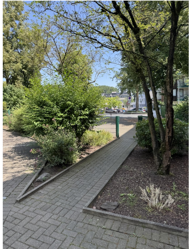
Zuwegung Parkplatz > Haus