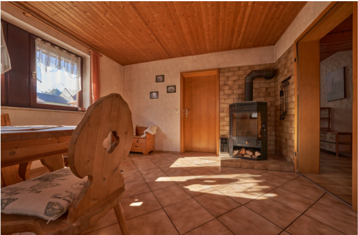
Zimmer 1 EG