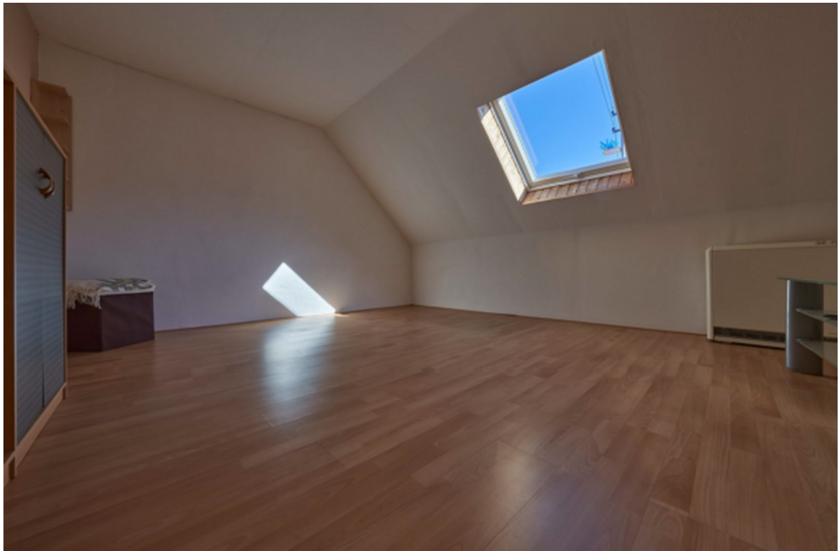
Zimmer 1 DG