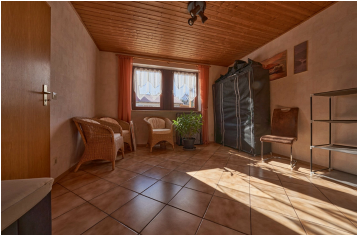
Zimmer 2 EG