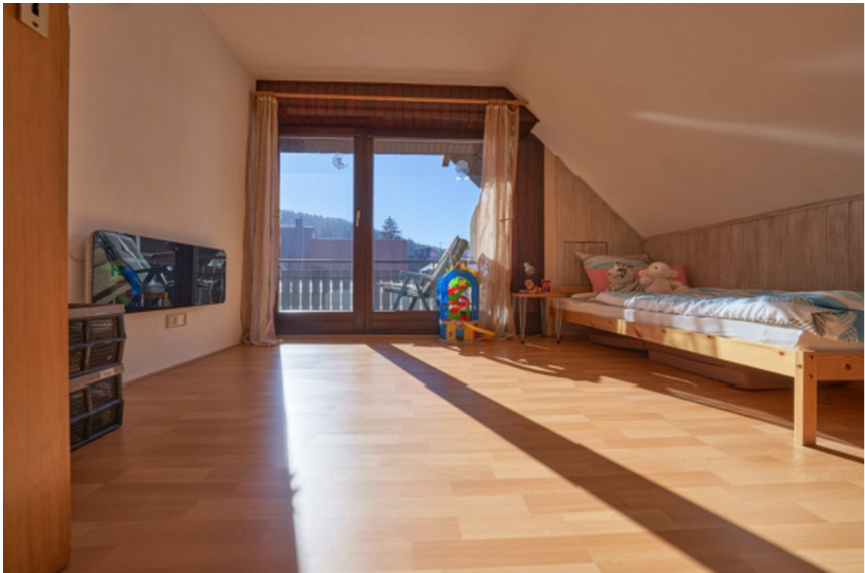
Zimmer 3 DG