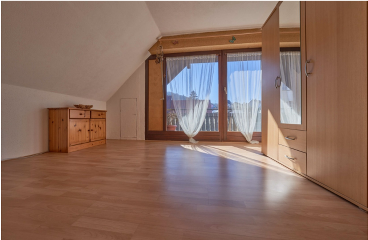
Zimmer 2 DG