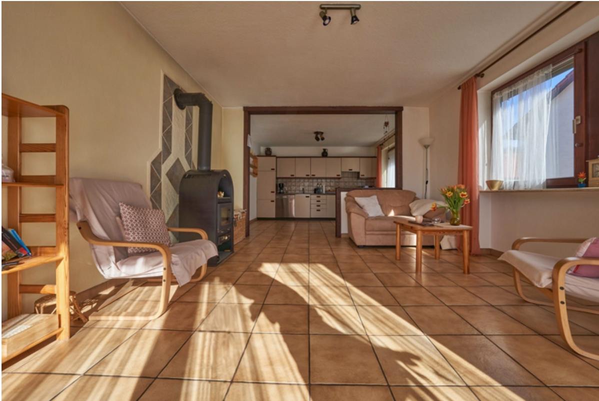
Koch- Ess- Wohnbereich OG