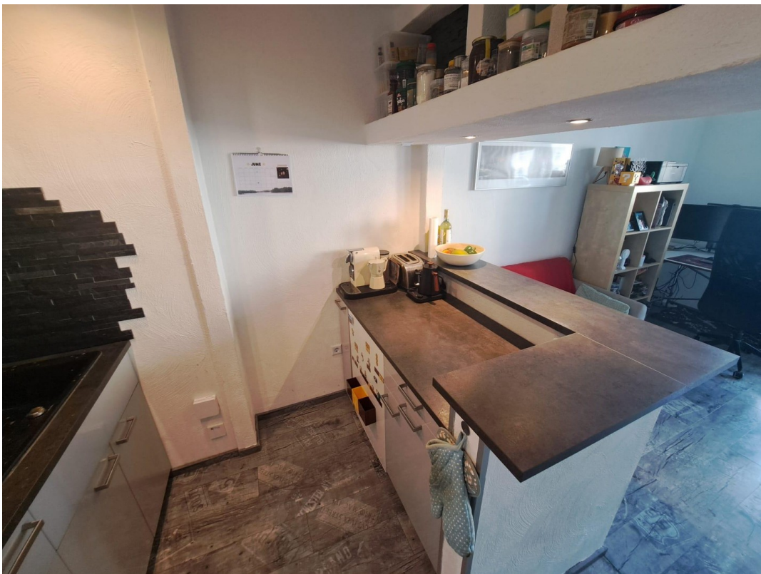
Offene Küche mit Thekenbereich