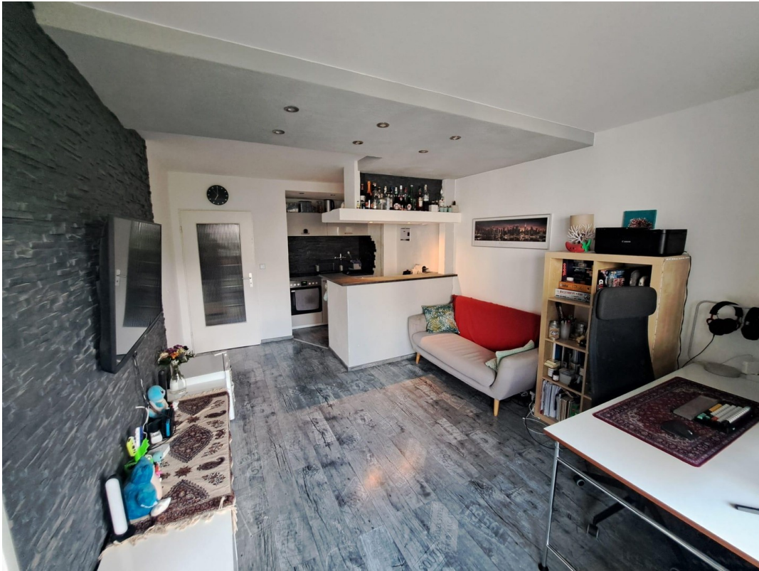
Blick vom Balkon in Wohnung