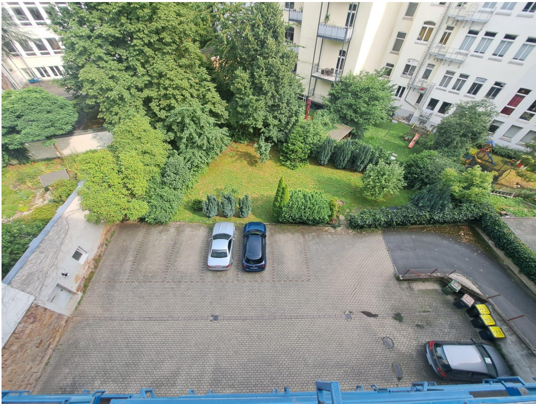
Blick in Hof und Garten