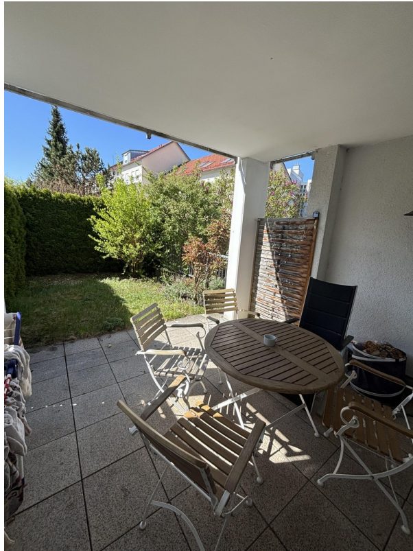
Garten und Terrasse