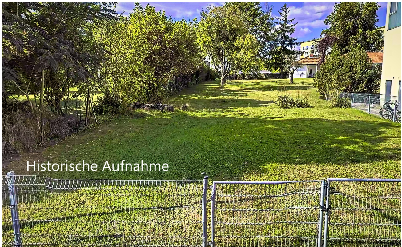
Sicht von Straße (hist.)