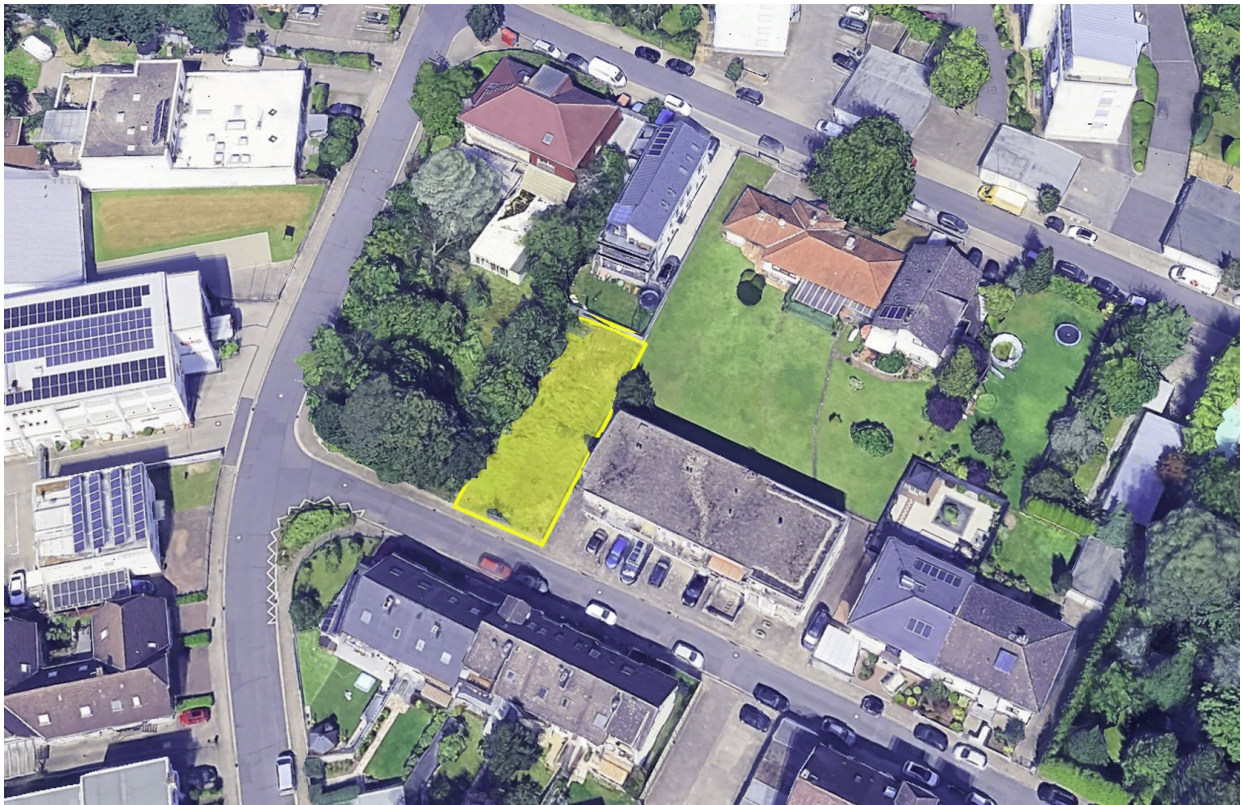
Luftbild (dir. Umgebung)