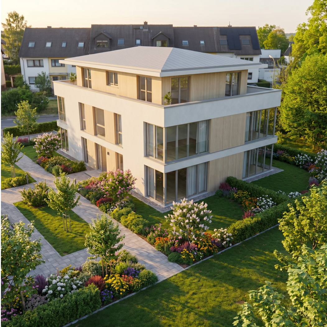
Baummöglichkeit - DHH