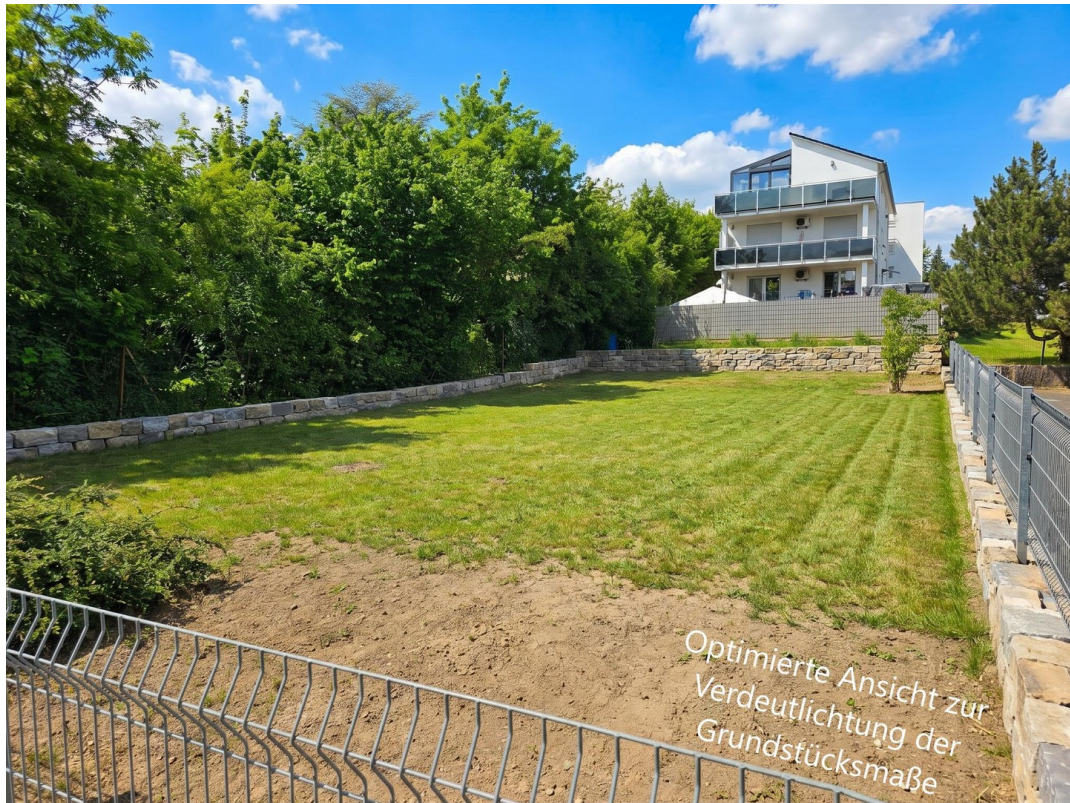
Sicht von Straße (symb.)