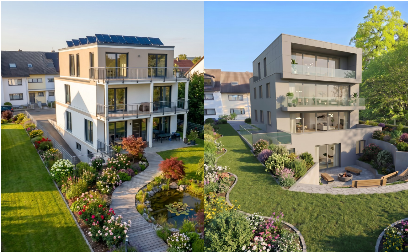
Baumöglichkeit - EFH mit TG