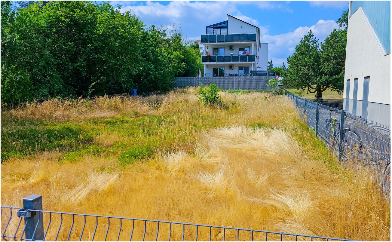
Sicht von Straße