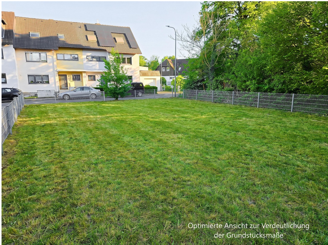
Sicht zur Straße (symb.)