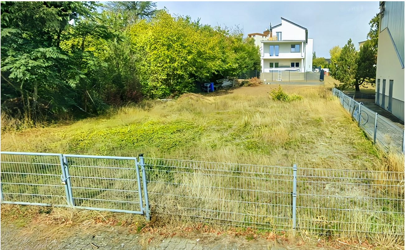
Sicht von Straße