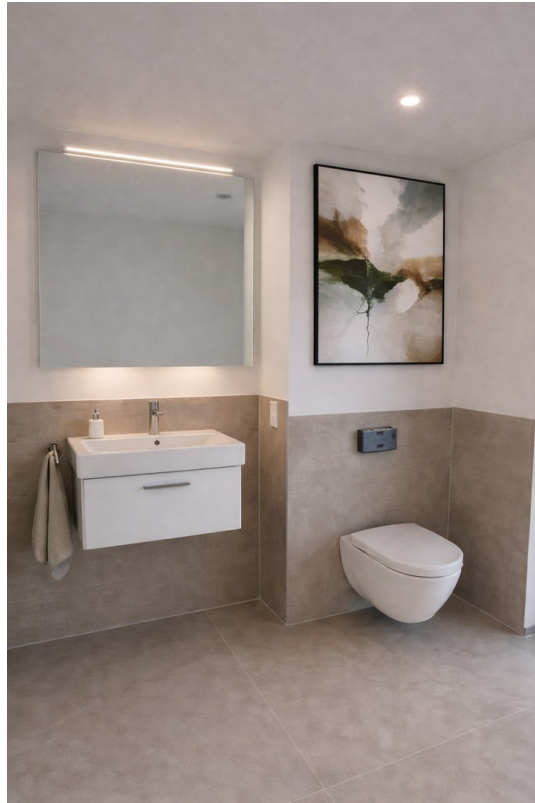
Bad OG Visualisierung