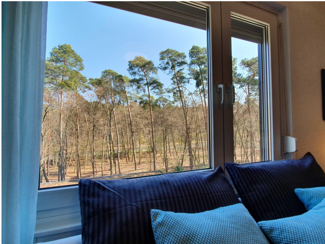
Blick in den Wald