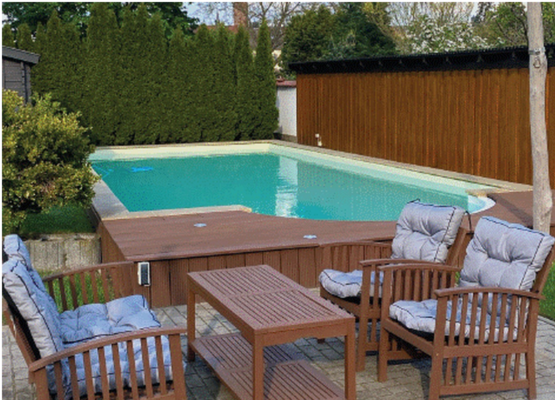
Außenanlage mit Pool