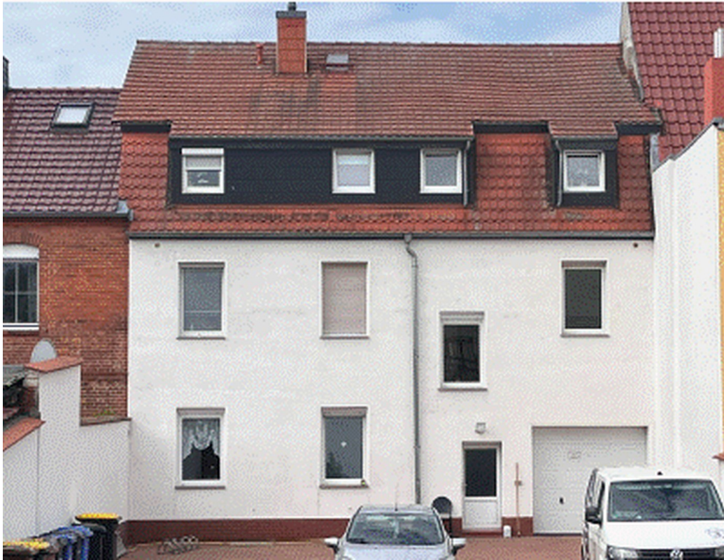
Ansicht vom Hof