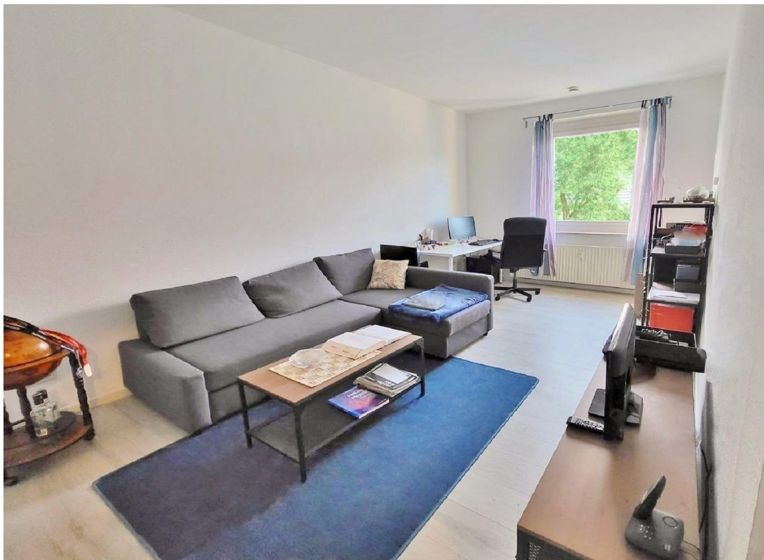
Zimmer II (Einrichtungsbeispiel)