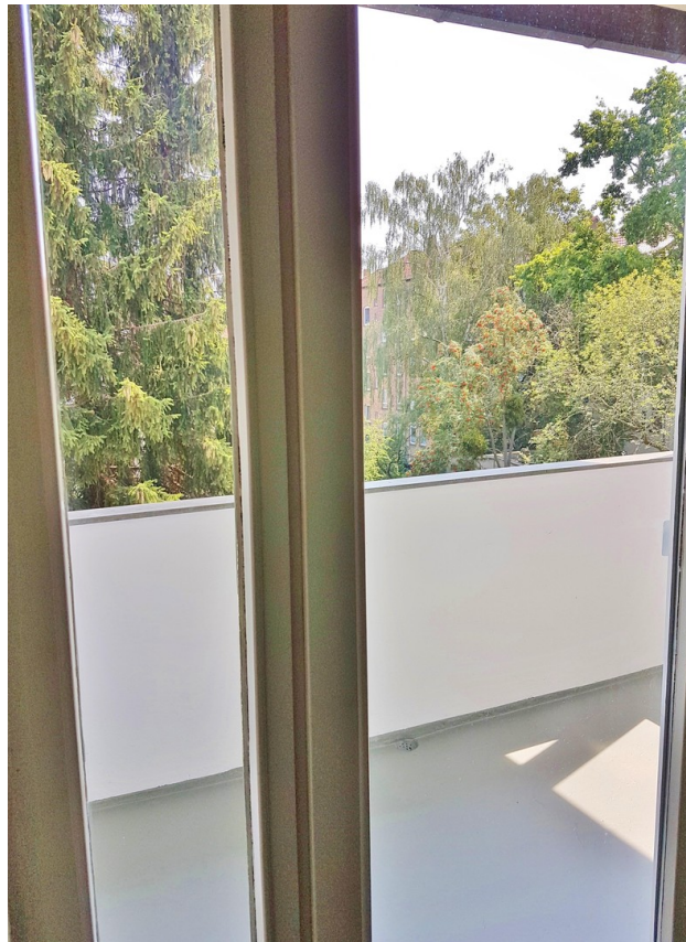
Küche zu Balkon