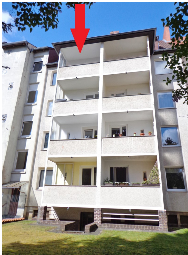
Rückseite mit Balkon