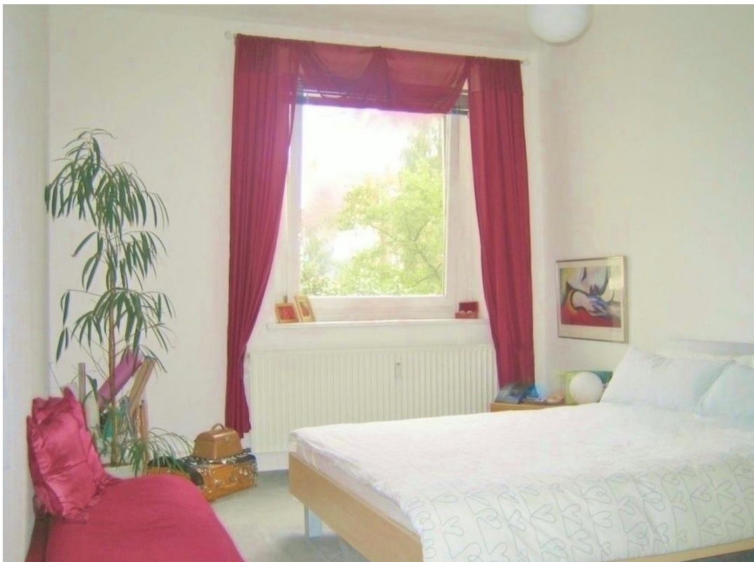
Zimmer I (Einrichtgsbeispiel)