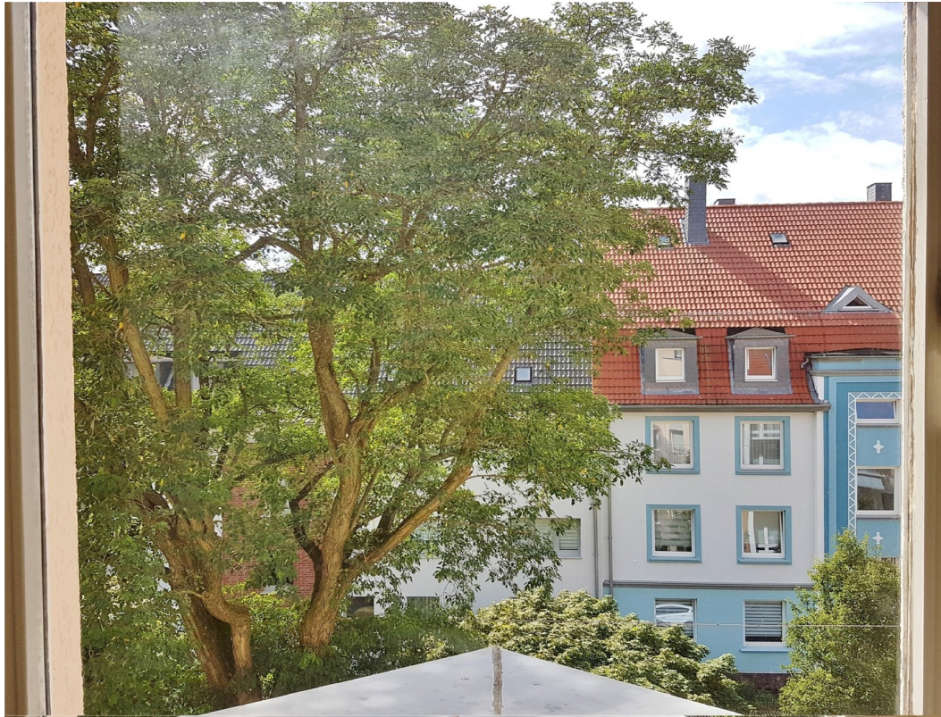
Ausblick Zimmer II