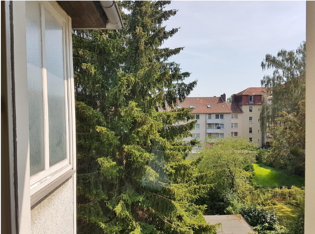
Ausblick Zimmer I