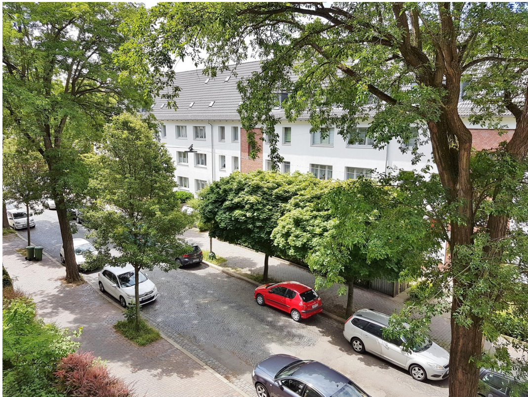
Ausblick Zimmer II