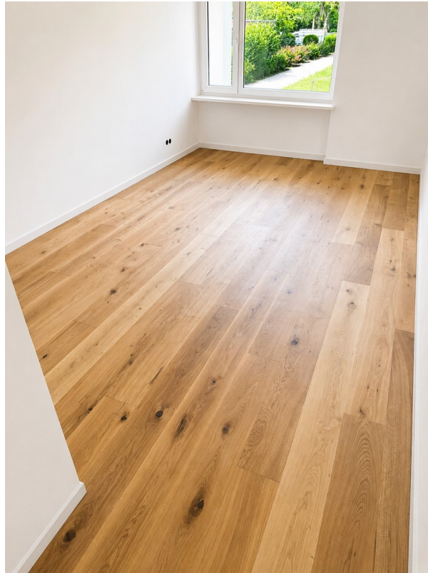
Schlafzimmer2 - akt. Stand